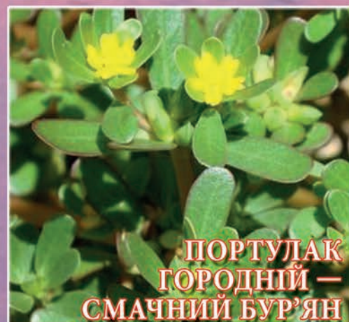
ПОРТУЛАК ГОРОДНИЙ — СМАЧНИЙ БУР'ЯН (стор. 27)