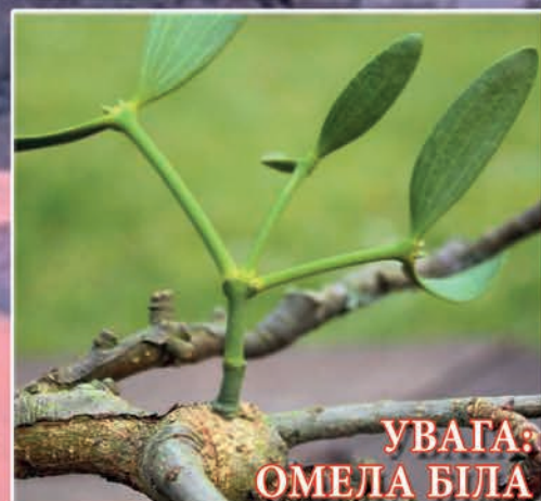
УВАГА: ОМЕЛА БІЛА (стор. 19)