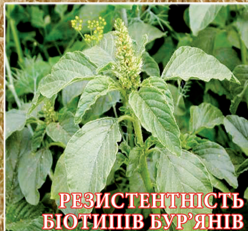
РЕЗИСТЕНТНІСТЬ БІОТИПІВ БУР'ЯНІВ (стор. 51)