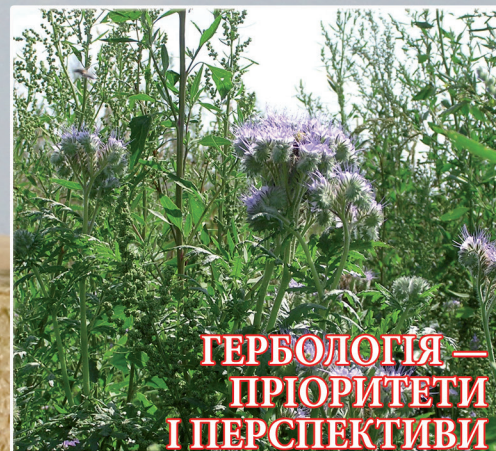
ГЕРБОЛОГІЯ — ПРІОРИТЕТИ І ПЕРСПЕКТИВИ (стор. 2)