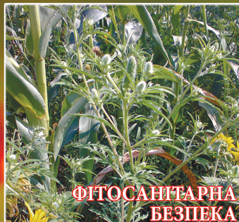
ФІТОСАНІТАРНА БЕЗПЕКА (стор. 1)