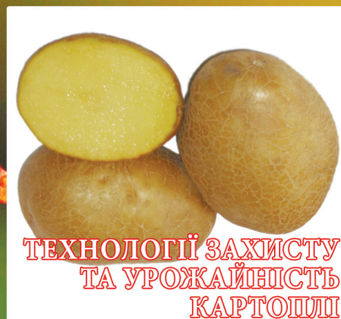
ТЕХНОЛОГІЇ ЗАХИСТУ ТА УРОЖАЙНІСТЬ КАРТОПЛІ (стор. 9)