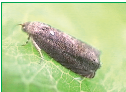
Рис. 1. Імаго маньчжурської плодожерки Cydia inopinata (Heinrich, 1928) [ http://www.jpmoth.org/Tortricidae/Olethreutinae/Grapholita_inopinata.html ]