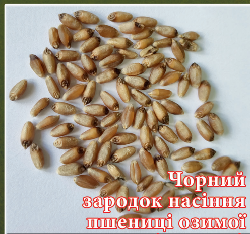
Чорний зародок насіння пшениці озимої (стор. 13)