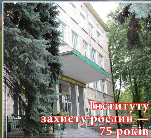
Інституту захисту рослин — 75 років (стор. 3)