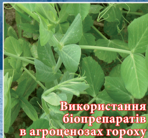
Використання біопрепаратів в агроценозах гороху (стор. 19)