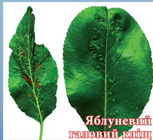
Яблуневий галовий кліщ (стор. 3)