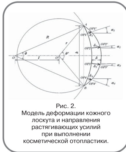
Рис. 2. Модель деформации кожного лоскута и направления растягивающих усилий при выполнении косметической отoplastики.