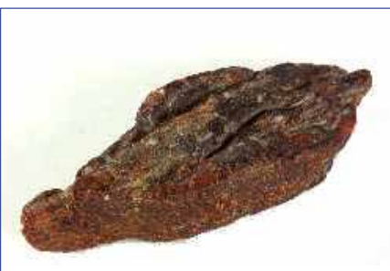
Рисунок 10. Руменіт [16]