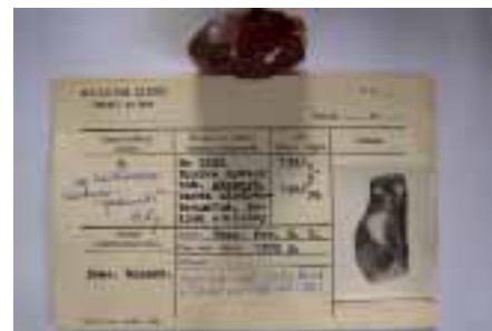
Рисунок 4. Голотип гедано-сукциніту (колекція Музею Землі ПАН)