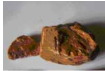
Рисунок 11. Неудорфіт з групи валховіту (колекція Геологічного музею ННПМ НАНУ)

Спектр кольорів бурштину Кудзі досить різноманітний. Прозорий бурштин зустрічається рідко, здебільшого бурштин Кудзі непрозорий, має оранжевий, жовтий та коричневий відтінки. Він не містить дощової води та вологи рослин, а в його складі є особлива речовина. За умови нагрівання до 330°C невеликого тонкого зразка з'являється запах камфори. Припускають, японський бурштин утворився зі смоли дерев особливих порід.