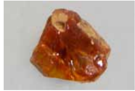
Рисунок 2. Геданіт (колекція Музею Землі ПАН)

Глесит – смола, описана О. Хелмом (1881). Назва походить від давньої назви бурштину – glessum , уживаною Тацитом під час опису використання бурштину німецькими племенами, проте саме глесит дуже рідко знаходили на пляжах Балтійського регіону. Роботи О. Хелма свідчать, що він мав більше двадцяти зразків з Балтії для своїх досліджень.