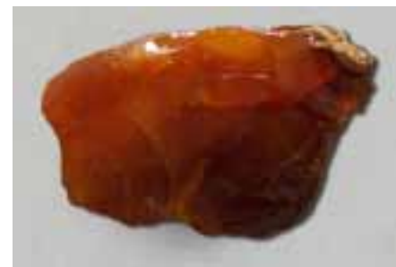
Рисунок 14. Японський бурштин (колекція Музею Землі ПАН)

Видобувають бурштин Кудзі з пластів пісковиків і кварцу, які формують частково берег моря, частково – височини. Значна кількість його знаходиться в пластах потужністю до 600 м. Через те, що рівень розміщення пластів з часом змінювався, в одному і тому ж шарі можна виявити бурштин, який сформувався в різні епохи. Більша частина бурштину Кудзі належить до крейдяного періоду (приблизно 80 млн років), інша – до олігоцену (приблизно 30 млн років) [4, 6, 12].