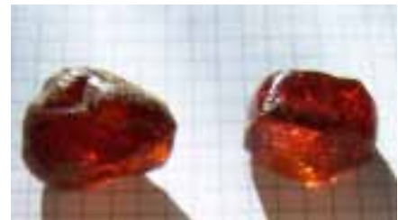
Рисунок 12. Симетит (колекція Музею Землі ПАН)

Часто зустрічається смугастий бурштин, схожий на агат. Виникнення смуг викликано скупченням темних мікроскопічних бульбашок. Значна частина бурштину, знайденого в шахті Кудзі, розколота під впливом землетрусів та тиском гірських порід. Багато зразків містять кварц, який, розплавляючись, затікав і кристалізувався в тріщинах.