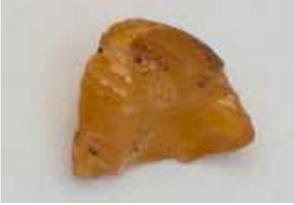
Рисунок 7. Гойтшит з родовища Гойтше (колекція Музею Землі ПАН)