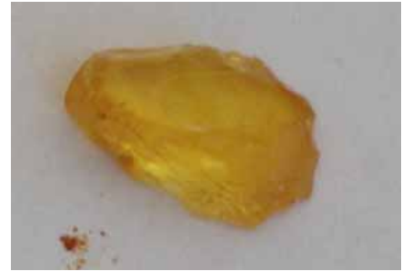
Рисунок 3. Гедано-сукциніт (колекція Музею Землі ПАН)