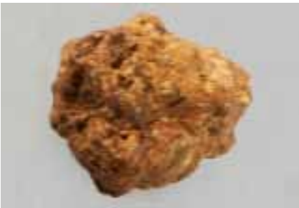
Рисунок 8. Зигбургіт (колекція Музею Землі ПАН)