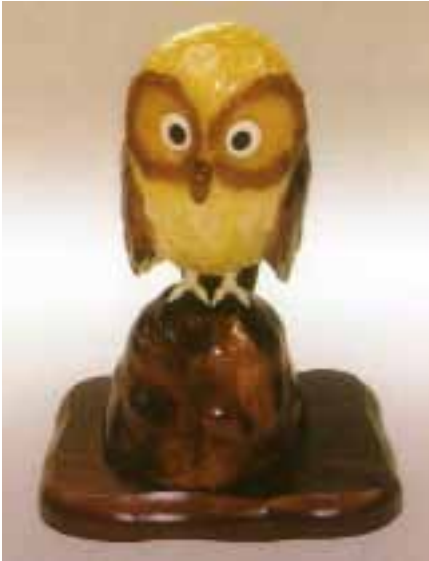
Рисунок 15. Сувенір, бурштин японський [6]

Бурміт – смола, описана О. Хелмом (1893), видобувалася у великому обсязі в Бірмі (зараз М'янма). Видобування та обробка велися ще з часів династії Хана (200 р. до н. е.). У Природничому музеї Лондона знаходиться зразок бурміту вагою 15 кг. У приватному музеї Штутгарда зберігається фігура Будди з бурміту розміром 25×25×10 см.