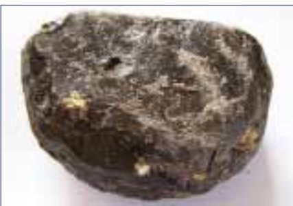
Рисунок 9. Кранцит у породі та зразки кранциту (колекція Музею Землі ПАН)