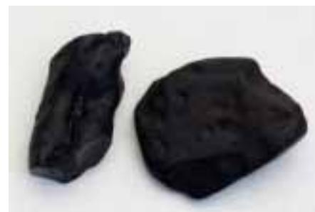
Рисунок 5. Стантьєніт з регіону Біттерфельд (колекція Музею Землі ПАН)

Зараз глесит практично не зустрічається на Балтійському узбережжі, і тільки окремі зразки глеситу з історичних колекцій Кенігсберга нині знаходяться в Геттінгені. Крім властивостей глеситу, О. Хелм також описує його специфічну структуру на зломі, яка нагадує стільники (численні мікроскопічні порожнини).