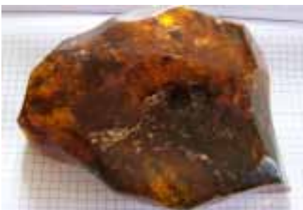
Рисунок 18. Домініканський бурштин (колекція Музею Землі ПАН)