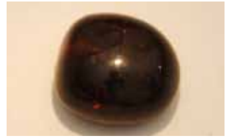
Рисунок 20. Мексиканський бурштин (колекція ДГЦУ)