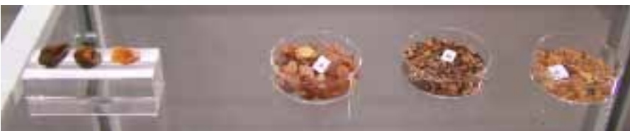
Рисунок 17. Седарит в експозиції Музею Землі ПАН