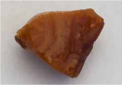
Рисунок 6. Глесит з родовища Гойтше (колекція Музею Землі ПАН)