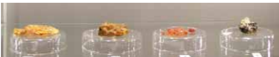
Рисунок 13. Бурштин ліванський в експозиції Музею Землі ПАН