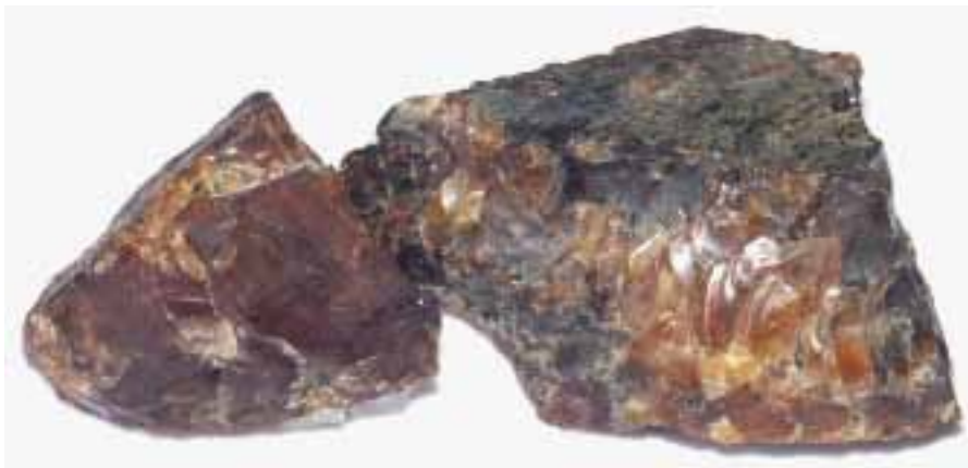
Рисунок 16. Бурміт

Домініканський бурштин – викопна смола, яку видобувають у східній частині острова Гаїті (Домініканська Республіка). На острові в північно-західному та південно-східному напрямках простягнулися п'ять гірських пасом. У двох з них – в Північних Кордильєрах (пів-