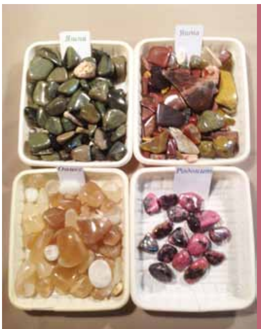
Рисунок 2. Галтовка