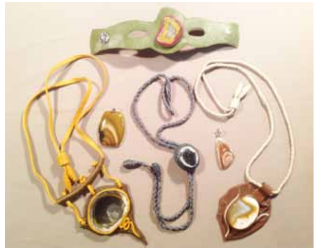
Рисунок 3. Готові вироби