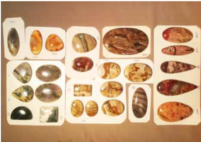
Рисунок 1. Кабошони