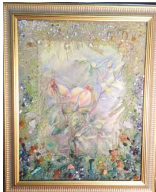
Рисунок 4. Елемент декору – картина