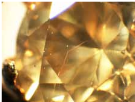
Рисунок 2. Голкоподібні включення. Збільшення \times 36

Мікроскопічні дослідження. Під час вивчення каменя за допомогою гемологічного мікроскопу з боку корони добре помітні рідкісні голкоподібні включення, які до того ж сходяться в одній точці (рис. 2). Включення такого типу фіксуються у різних частинах каменя.