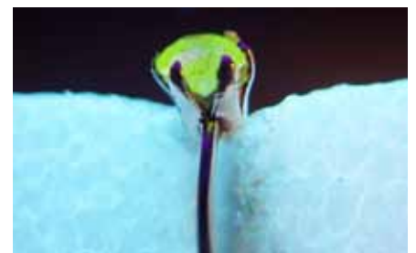
Рисунок 4. Флуоресценція жовтого кольору

діаманта було облагороджено методом НРНТ [3].