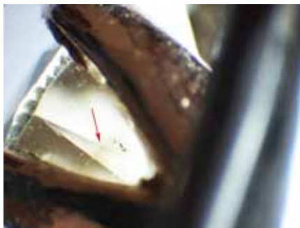
Рисунок 3. Грейнінг коричневого кольору з боку павільйону. Збільшення \times 36

Також спостерігаються хмароподібні включення. З боку павільйону вдалося виявити грейнінг коричневого кольору (рис. 3).