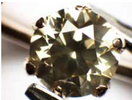
Рисунок 1. Діамант у каблучці. Збільшення \times 20

Методи дослідження. Ограновану вставку було досліджено гемологічними методами, а також методом інфрачервоної спектроскопії (далі – ІЧ-спектроскопія) і опромінюванням УФ-хвилями за допомогою приладу «DiamondView™».