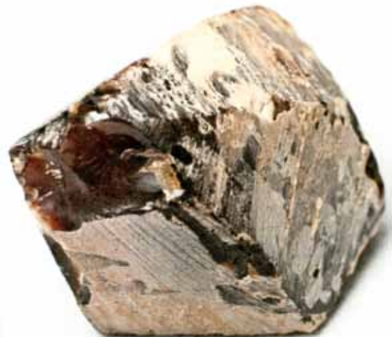
Рисунок 5. Псевдоморфоза викопної смоли (глеситу) по кальциту [5]

Результати детального вивчення «індонезійського бурштину» вказують, що його джерелом були дерева Shorea robusta з родини Dipterocarpaceae, типові для тропічної частини Азії. На території Європи залишки дерев цієї родини не виявлено, але подібність ІЧ-спектрів глеситу з Європи, що походить з живиці дерев роду Burseraceae, і глеситу з Борнео, свідчить про генетичний зв'язок цих двох родів дерев. Вік глеситу з Борнео визначено в діапазоні 20–35 млн років [6].