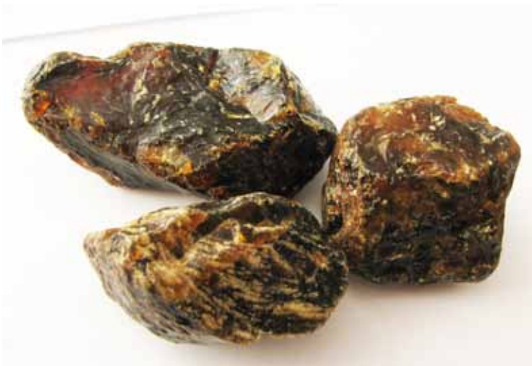
Рисунок 9. Глесит якості «Asalan»

Автор висловлює щирі подяку за допомогу та консультації професору, доктору наук Барбарі Космовській-Церанович (Музей Землі ПАН).