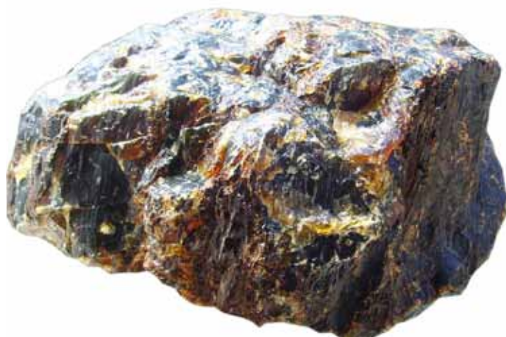
Рисунок 1. Зразок глеситу вагою 1200 г

The article deals with the indonesian glessite, a new type of fossil resins on the Ukrainian market. The author gives a brief description and information about the history of the research, production and use, dwells on gemological characteristics and unique features of the glessite.