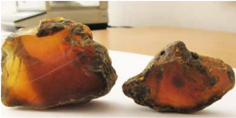
Рисунок 8. Глесит якості «Kristal»