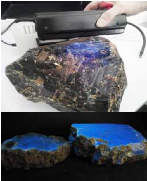
Рисунок 6. Люмінесценція глеситу в ультрафіолетовому випромінюванні

Іншою, надзвичайно цікавою знахідкою, є псевдоморфоза смоли (глеситу) по кальциту, яка була досліджена і вперше описана в Музеї Землі ПАН [5]. Авторами описано зразок масою 38,7 г, який представляє собою природний багатогранник, що нагадує за своїми характеристиками кристал кальциту (рис. 5). Цей «фальшивий кристал», в якому первинна субстанція \text{CaCO}_2 повністю заміщена смолою, має обрис скаленоедру, характерного для кальциту, який росте в морському середовищі, на що вказує інтенсивний ріст псевдокристала вздовж осі С. Кристали кальциту, що кристалізуються у прісній волі, мають ознаки інтенсивного перпендикулярного зростання до осі С. Крім кристалографічних вимірів, про його первинний кальцитовий склад свідчать результати дослідження збережених поверхонь стінок кристала за допомогою скануючого електронного мікроскопу з приставкою EDS.