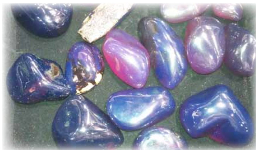
Рисунок 7. Blue/mixed color – сировина високої якості, прозора, з блакитним або фіолетовим відтінком

Треба зазначити, що у разі значних замовлень (більше 1000 кг) вартість може бути значно знижена.