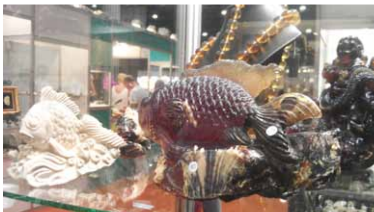
Рисунок 2. Вироби з глеситу («Ambermart» 2015)

У 2013–2014 роках на чорному ринку бурштину в Україні з'явилися зразки «бурштину» темно-коричневого кольору вагою до 7–8 кг, які продавали як «унікальний» український бурштин. Спеціалісти одразу звернули увагу на незвичайний колір, форму та розмір сировини – пропонувалися уламки від 500 г і більше (рис. 1).