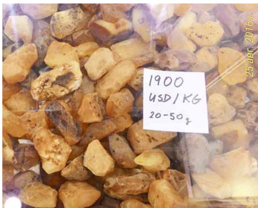
Рисунок 2. Пропозиція бурштину фракції 20-50 г на «Ambermart 2016»