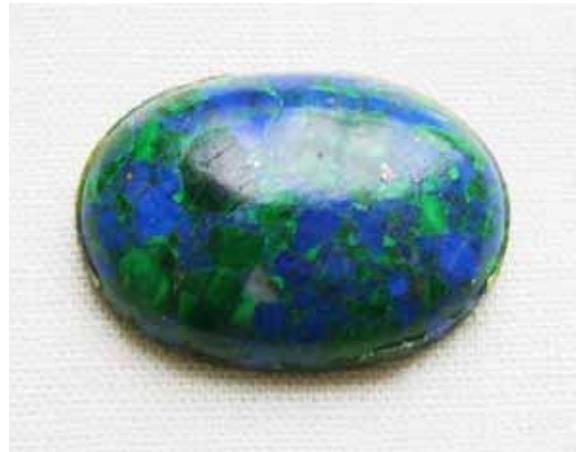
Рисунок 2. Кабошон з ейлатського каменю