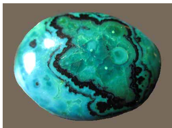
Рисунок 6. Кабошон з ейлатського каменю