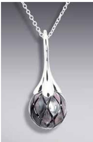
Рисунок 6. Різьблена перлина, «Galatea» [4]