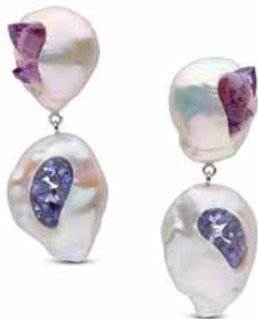
Рисунок 8. Прісноводні перли в тандемі з кристалами аметистаму, танзаніту, Хісано Шеперд [1]