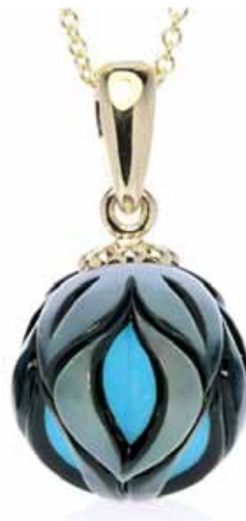
Рисунок 7. Синтетична бірюза в перлині, «Galatea» [4]