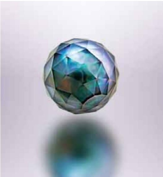
Рисунок 3. Огранована таїтянська перлина Віктора Тузлукова, Ø 17 мм (США, приватна колекція). Фото В. Тузлукова