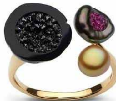
Рисунок 9. Каблучка з таїтянською перлиною, що інкрустована чорними алмазами, таїтянською перлиною-кеші в тандемі з рубінами та перлиною-кеші Південних морів, Хісано Шеперд [1]