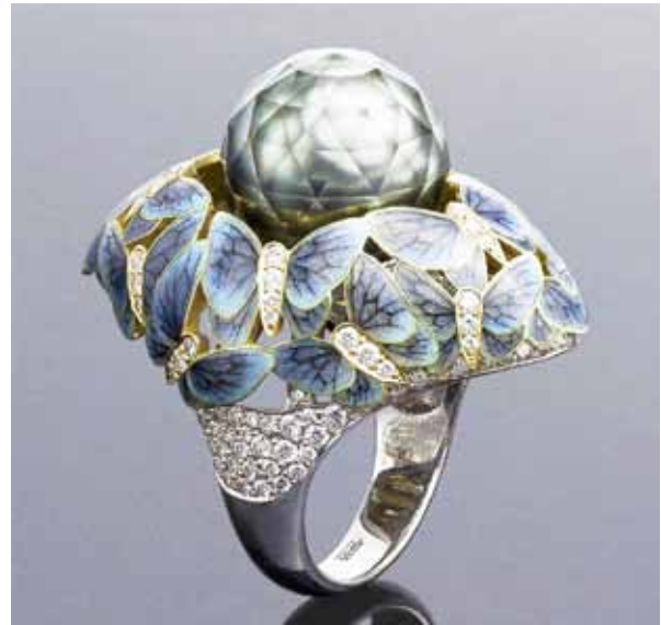
Рисунок 4. Обручка «Метелики». Ільгіз Фазулзянов, Віктор Тузлуков. Фото В. Тузлукова