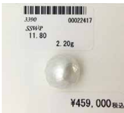
Рисунок 1. Огранована перлина Південних морів, Ø 11,8 мм [2]

Отже, сьогодні з'явилося багато технік обробки культивованих перів, які диктує ринок світової моди.