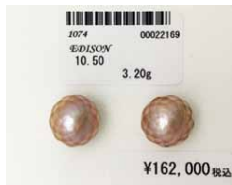
Рисунок 2. Ограновані прісноводні перли Едісона, Ø 10,50 мм [2]