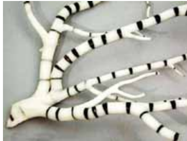
Рисунок 9. Бамбукові корали виду Keratoisis profunda [6]

Природний колір вапняних частин корала кремово-білий, у великих видів – брудно-білий або блідо-коричневий, а вузлів – темно-коричневий або чорний (рис. 10).