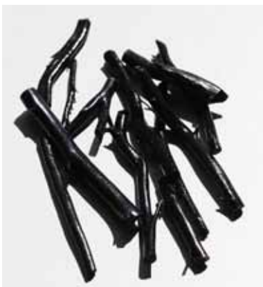
Рисунок 5. Гілки чорного корала Antipatharia spp.

Чорний корал Antipatharia spp. (додаток II) – термін, що вживається для групи глибоководних, деревоподібних коралів, які зазвичай зустрічаються в тропіках. Жива тканина чорного корала має блискучу поверхню. Чорний корал не вапняний, його скелет складений міцним кератиноподібним білком, який називається конхіоліном, або горгоніном (рис. 5).