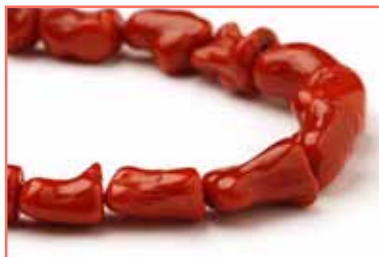
Рисунок 3. Corallium rubrum (не включені до CITES) [6]