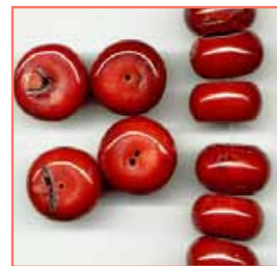
Рисунок 11. Пофарбовані зразки бамбукового корала [6]

мерційної торгівлі) може мати паралельні поздовжні смужки, схожі на смужки Corallium . Відстань між смужками варіюється приблизно на від 0,4 до 1 мм. Ці смужки особливо помітні у фарбованих зразках. У поперечному розрізі також може бути видно концентричні смужки. У бамбукових коралів використовують лише кальцитові ділянки, тому їх дуже важко відрізнити від Corallium , якщо під час експертизи не виявлено залишків барвника або воску (рис. 11) [3].