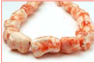
Рисунок 2. Corallium secundum [6]