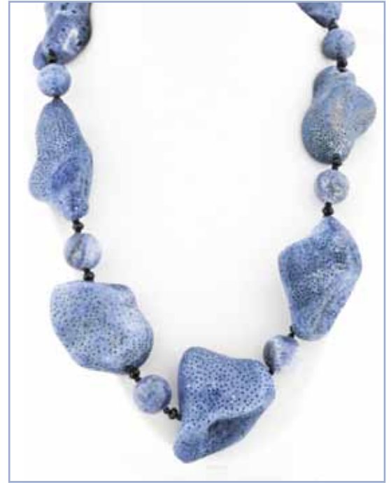
Рисунок 7. Блакитний корал Heliopora coerulea

Блакитний корал Heliopora coerulea (підклас Octocorallia ) (додаток II) – природний кальцитовий корал блакитного кольору з грубим і пористим вапняним скелетом. Пориста, відносно гладка поверхня блакитного корала має пори двох розмірів: великі – діаметром 0,7–1,0 мм і малі – 0,1 мм. Через це його важко використовувати для виготовлення ювелірних прикрас, тому він менш цінується на ринку. Блакитний корал зазвичай піддають облагородженню шляхом фарбування та заповнення порожнин для підвищення його довговічності (рис. 7).