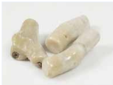
Рисунок 10. Природний колір вапняних частин бамбукового корала [6]

Природний колір вапняних частин корала кремово-білий, у великих видів – брудно-білий або блідо-коричневий, а вузлів – темно-коричневий або чорний (рис. 10).