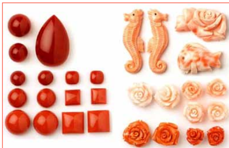
Рисунок 4. Варіації кольору Corallium [6]

За відомостями CITES, не існує особливостей, достатніх для надійної ідентифікації на рівні видів у межах роду Corallium як для коралів у необробленому вигляді, так і у вигляді ювелірних виробів, які становлять основний сегмент ринку [6].