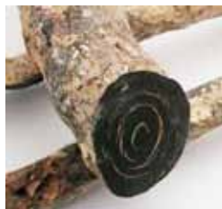
Рисунок 6. Поперечний розріз чорного корала [6]

Правильно підготовлені та відшліфовані шматки практично прирівнюються до вапняних типів коралів за довговічністю і красою, навіть можуть перевищувати їх за ціною.