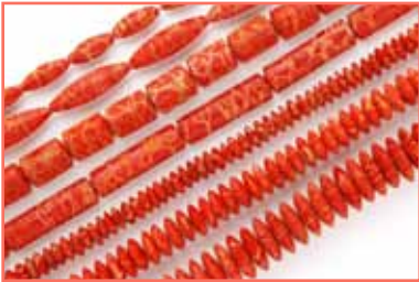
Рисунок 8. Губчастий корал Melithaea ochracea [6]

рунком чи коричневими плямами або завихреннями, які видно на полірованих поверхнях; червоний пігмент може бути видимим у дефектах, отворах і на полірованій верхні (рис. 8).