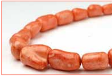
Рисунок 1. Corallium elatius [6]

Червоний і рожевий корали Corallium spp. (Додаток III) (далі – Corallium ) відрізняються міцним та інтенсивно забарвленим скелетом, вони найцінніші з дорогоцінних коралів (рис. 1–3).