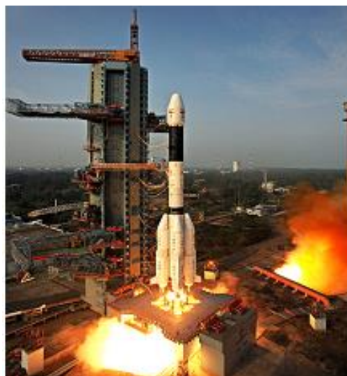
Рис. 3. СК космического центра Сичан (Китай) с подготовленной к пуску РКН CZ-5

Пусковая установка (ПУ) занимает центральное место в оборудовании СК и наряду с ракетами космического назначения является не менее важной составной частью ракетного комплекса. Именно совершенствование ПУ, во многом определяющих технический облик ракетных комплексов, позволило решать задачу обеспечения живучести. Стартовый стол (СС) является составной частью ПУ.