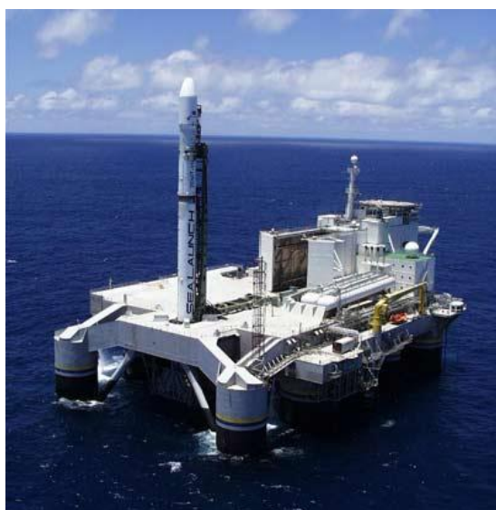
Рис. 1. СК в виде морской платформы с подготовленной к пуску РКН «Зенит»