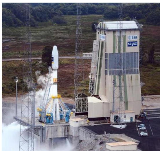
Рис. 2. СК Европейского союза с подготовленной к пуску РКН «Вега» (Французская Гвиана)

На этапе проектирования СК могут решаться следующие задачи: