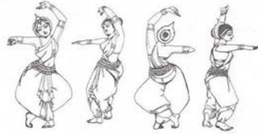
Рис. 1. Деванагарі — знаки і танець-комунікація

Нині санскрит — це не «мертва» мова, його справедливо вважають мовою освіченого населення й використовують для релігійних диспутів та, подібно до латині в Європі, є науковою мовою — на його основі побудована вся термінологія Джйотиш (ведична астрологія), Аюрведи (деванагарі — «наука життя»), інших ведичних наук, які нині відроджуються. Санскритський алфавіт деванагарі є також алфавітом хінді й інших сучасних мов північної Індії [16]. Санскрит як мова належить до індо-європейської мовної групи і є однією з найдавніших у світі; це основа сакральної індійської літератури, священних текстів, мантр і ритуалів ведизму, індуїзму, джайнізму, частково — буддизму.