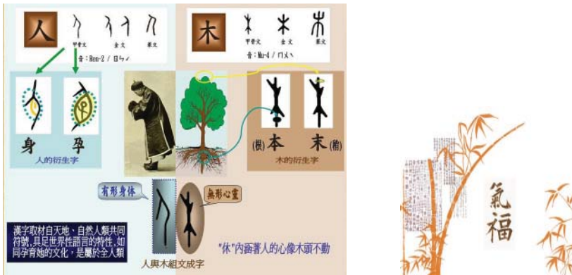
Рис. 4. Природні форми ієрогліфів

Відомий танський письменник і художник Цзан Янь Юань пояснив, як слід розуміти цей факт: «Небо не могло більше утримувати свої секрети від людей. Люди, навчившись писемності, вже могли розпізнавати небесні таємниці. Це схоже на щасливий акт провидіння, коли зерна проса самі сиплються з Неба». У легенді також зазначається, що завдяки китайським ієрогліфам «люди набули можливості пізнавати принципи й основні закони світоустрою. Злі духи більше не могли так легко вводити в оману людей, тому вони плакали» [4]. Якщо уважніше розглянути хитросплетіння гілочок бамбука, то, як і Цан Цзе, можна побачити в них ієрогліфи.