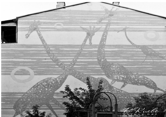
Іл. 3. "Рожеві жирафи". Художник Ігор Новаковський. Фасад будинку на вулиці Володимирській, 75. Київ

Графіті з рожевими жирафами з'явилося в 2004 році на місці неприглядної цегляної стіни. У будинку навпроти розміщувалося об'єднання архітекто-