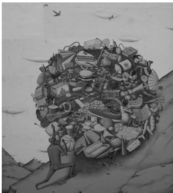
Лл. 7. “Сізіфів труд”. Художники арт-дуєт “Interesni Kazki”. Єкатеринбург, Росія

Висновки. Така ситуація може ставатися знову та знову. Це не залежить ні від особистості художників, ні від ідейного наповнення зображуваного, навіть не від місця створення картини. Графіті саме по собі — мистецтво масове. Його прояви були завжди не всім зрозумілими. Навіть за таких, здавалося б, позитивних обставин — надання сірому міському простору життя — є противники, протиборці. Лякає масовість появи муралів на міських стінах, про що не забарилися висловитися мистецтвознавці: “Центральна частина міста використовується або як рекламна площа, або ж для висловлення амбіцій художників. Порушується поняття архітектурного ансамблю чи промислового дизайну” [2]. Задля того, щоб уникнути таких побоювань не треба жодних фінансових витрат, лише разом з дозволами на нанесення зображень від районних адміністрацій затверджувати ескіз майбутнього витвору мистецтва. Столиця велика, сірих будівель достатньо, тому полотно можна створювати ще протягом десятиліть, перетворюючи місто на великий музей просто неба.