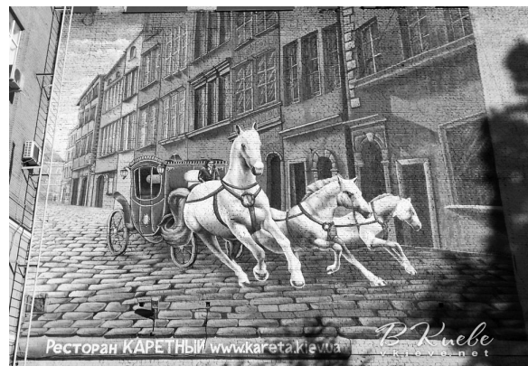
Іл. 4. "Червона карета з трійкою білих коней". Художники студії "SprayWay". Двір будинків на вулиці Прорізна. Київ

3D-графіті на боковій стіні будинку на Великій Васильківській, 38 було створене в квітні 2013 року студією "SprayWay" як реклама пивного бренду. Творці стріт-арта разом з креативним агентством Lovemarks creative studio за підтримки пивного