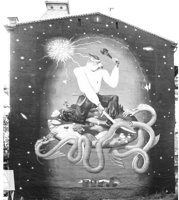
Іл. 6. “Український Святий Георгій”. Художники арт-дуєту “Interesni Kazki”.

Беззаперечно, що виникнення нового патріотичного зображення могло статися, такі прояви лише розширюють українську арт-галерею просто неба. Виникає питання: невже закінчилися неприглядні площі стін у столиці? Для нанесення на поверхню мурала, цього разу присвяченого українському народові, який виник в уяві художників у образі