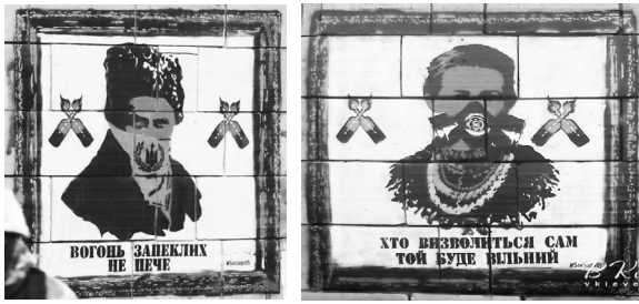
Іл. 1. "Ікони Революції". Художник Sociopath. Фасад будинку на вулиці Грушевського, 4. Київ

значеного правопорушення внесені до ЄРДР за ст. 298 КК України — "Нищення, руйнування або псування пам'яток історії чи культури" [15].