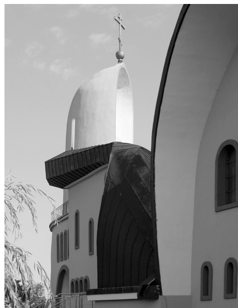
Rys. 2. Hajnówka. Cerkiew Świętej Trójcy. Dzwonnica

Asymetryczne elewacje cerkwi Świętej Trójcy w Hajnówce są swobodnie skomponowane. Odczytujemy w nich jednak, podobnie jak w całej