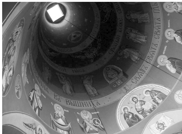
Rys. 6. Hajnówka. Cerkiew Świętej Trójcy. Wnętrze kopuły

Choć autor świątyni zdecydowanie odcina się od eklektycznej, historyzującej manieri, powszechnej we współczesnych cerkwiach [4, passim ] (co zapewne można wiązać z modernistyczną konwencją obiektu), to jednocześnie nie odcina się od tradycji. Pod tym względem jest to ewenement ( precedens ) w polskiej architekturze cerkiewnej. Na kanwie geometrycznych, uporządkowanych elementów oraz układu wyrastającego z bizantyńsko-ruskich tradycji zbudowana jest luźna, współczesna forma. Elewacje tej świątyni są zatem spójną z bryłą reinterpretacją historycznego układu, noszącą cechy modernistyczne. W ich rysunku również wyraźnie widać indywidualny styl twórcy.