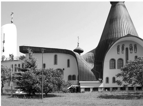
Rys. 4. Hajnówka. Cerkiew Świętej Trójcy. Elewacja południowa

Łuki i sklepienia, z krzywizną zbliżoną do kształtów parabolicznych, stanowią pewne novum. Wieża (kopuła) w przecięciu kolebek ma formę ściętego stożka, co również jest elementem nowatorskim. W zewnętrznej formie świątyni hajnowskiej odczytujemy pewną miękkość bryły i elewacji (rys. 3, 4), co niewątpliwie należy do cech tradycyjnych [2, 45—46]. Każda elewacja jest przemyślana i stanowi oryginalną kompozycję. Przy pomocy niewielu środków wyrazu, jak obramienia wokół okien, paraboliczny łuk, miękka linia, uzyskano bogactwo formalne. Cebulaste kształty kopuł na przeszklonych sześcianach, zwieńczające główną wieżę-kopułę i stożek nad baptysterium, wydają się organicznie wyrastać z formy świątyni, choć stanowią silny element sygnalizujący jej przynależność eklezjalną. Choć bryła cerkwi budowana jest przy pomocy linii krzywych, to jednak w rysunku elewacji ich przewaga następuje tradycyjnie w wyższych partiach, zwłaszcza w dachu. Wymowę tego dachu o dynamicznej formie, położonego na znacznej wysokości, a więc niedostępnego, wpływającego jednak miejscami do samego dołu można odczytać jako symbol fani Trójcy Świętej w ludzkiej rzeczywistości. Apsyda, oparta na planie wycinka koła, w elewacji została zaznaczona wyraźnie, choć subtelnie.