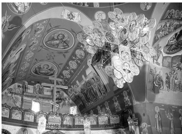
Rys. 5. Hajnówka. Wnętrze cerkwi Świętej Trójcy

Łuki i sklepienia, z krzywizną zbliżoną do kształtów parabolicznych, stanowią pewne novum. Wieża (kopuła) w przecięciu kolebek ma formę ściętego stożka, co również jest elementem nowatorskim. W zewnętrznej formie świątyni hajnowskiej odczytujemy pewną miękkość bryły i elewacji (rys. 3, 4), co niewątpliwie należy do cech tradycyjnych [2, 45—46]. Każda elewacja jest przemyślana i stanowi oryginalną kompozycję. Przy pomocy niewielu środków wyrazu, jak obramienia wokół okien, paraboliczny łuk, miękka linia, uzyskano bogactwo formalne. Cebulaste kształty kopuł na przeszklonych sześcianach, zwieńczające główną wieżę-kopułę i stożek nad baptysterium, wydają się organicznie wyrastać z formy świątyni, choć stanowią silny element sygnalizujący jej przynależność eklezjalną. Choć bryła cerkwi budowana jest przy pomocy linii krzywych, to jednak w rysunku elewacji ich przewaga następuje tradycyjnie w wyższych partiach, zwłaszcza w dachu. Wymowę tego dachu o dynamicznej formie, położonego na znacznej wysokości, a więc niedostępnego, wpływającego jednak miejscami do samego dołu można odczytać jako symbol fani Trójcy Świętej w ludzkiej rzeczywistości. Apsyda, oparta na planie wycinka koła, w elewacji została zaznaczona wyraźnie, choć subtelnie.