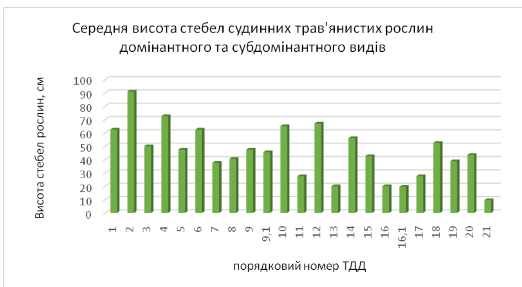
Рис. 1 – Середня висота стебел судинних трав'янистих рослин домінантного та субдомінантного видів заплавної комплексу р. Уди в межах м. Харкова

Для аналізу середньої висоти стебел рослин було взято показник середньої висоти стебел судинних трав'янистих рослин домінантного та субдомінантного видів (рис. 1).