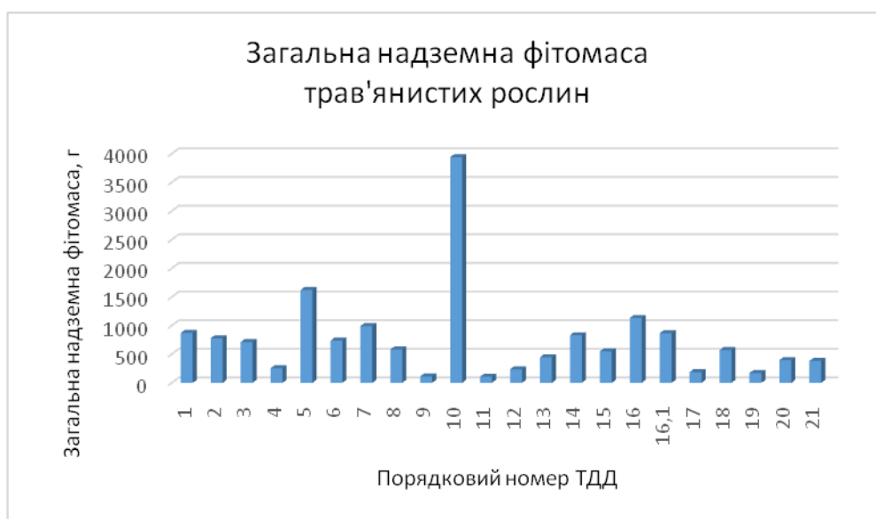
Рис. 3 – Загальна надземна фітомаса трав'янистих видів рослин заплавлених комплексів р. Уди в межах м. Харкова

кого заказника (ТДД №10), проте мінімальне значення даного показника також помічене на даній території (ТДД №11), а також