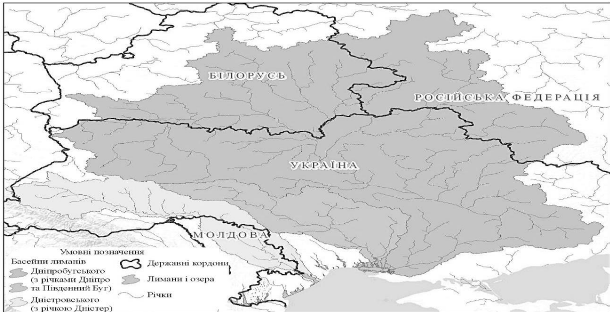
Рис. 2 – Басейни водозбору Дніпробугського і Дністровського лиманів (включаючи водозбірні басейни річок, які впадають у ці лимани)