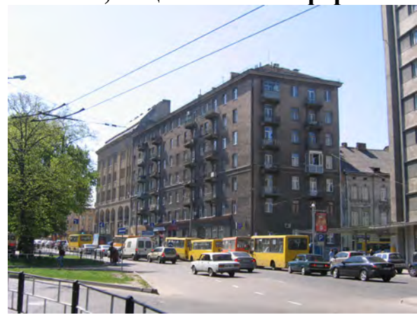
Рис. 4. Єдиний реалізований об'єкт нової міської площі Львова – будинок на пр. Чорновола, 7