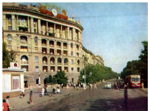
Рис. 6. Забудова 1950-х років головної вулиці Дніпропетровська – проспекту Карла Маркса