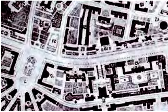
Рис. 1. Генплан відбудови Хрещатика