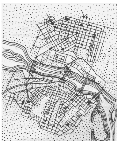
Рис. 5. Схема генерального плану Дніпропетровська, 1933р.