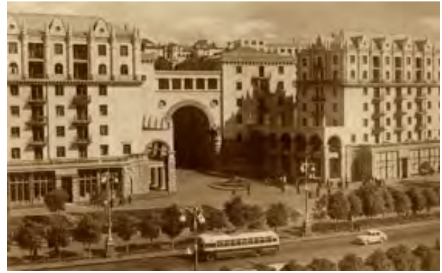
Рис. 2. Архітектура Хрещатика 1950-х років – «соціалістична за змістом, національна за формою»