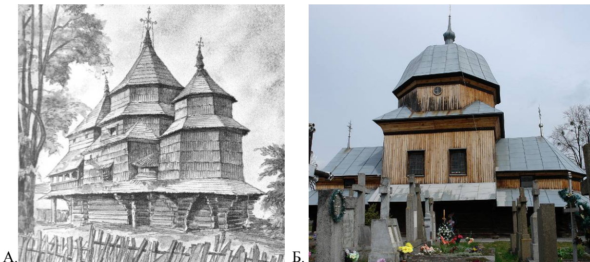
Рис. 1. А. Випадки поєднання конструктивних типів верхів. А. – поєднання різних зрубних модулів (церква з м. Турка Львівської області, 1787 р., малюнок А. Вариводи); Б – поєднання зрубних і кроквяних модулів (Церква Різдва Богородиці, 1705 р., м. Жовква Львівської області).

П'ять базових типів конструкції церковних верхів, що були виявлені нами в попередньому дослідженні 1 і мають різну генезу 1 , частіше зустрічаються не в чистому вигляді (тобто – один тип в одній церкві), а в змішаному. При цьому, спостерігаємо не лише варіанти поєднання декількох конструктивних типів в різних верхах однієї церкви, але і їх комбінації в одному церковному верху, звичайною практикою є також поєднання декількох типів верхів в одній споруді по обох вищеназваних показниках. При цьому, в структурі однієї пам'ятки виникають як поєднання зрубних покрить різних типів (рис. 1а), так і поєднання зрубних та кроквяних (дахових) покрить (рис 1б).