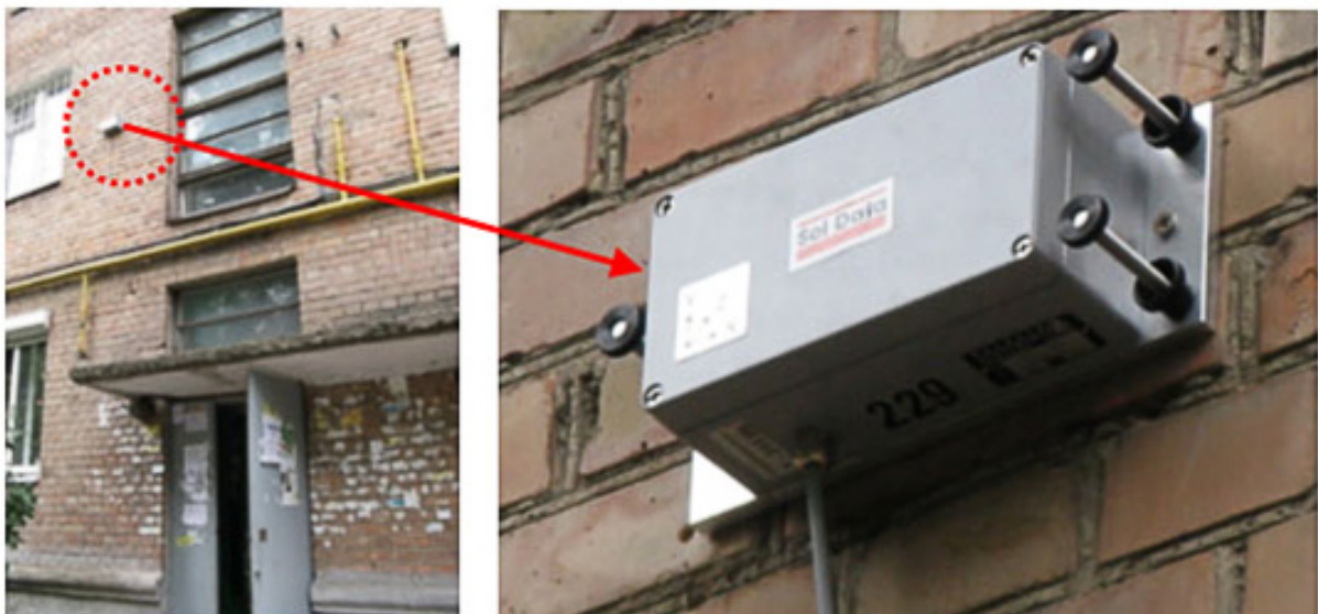
Рис.1 Установка трьох осьових геофонів