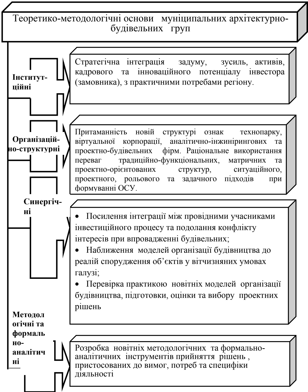
Рис.1. Базові основи започаткування АБГМ.