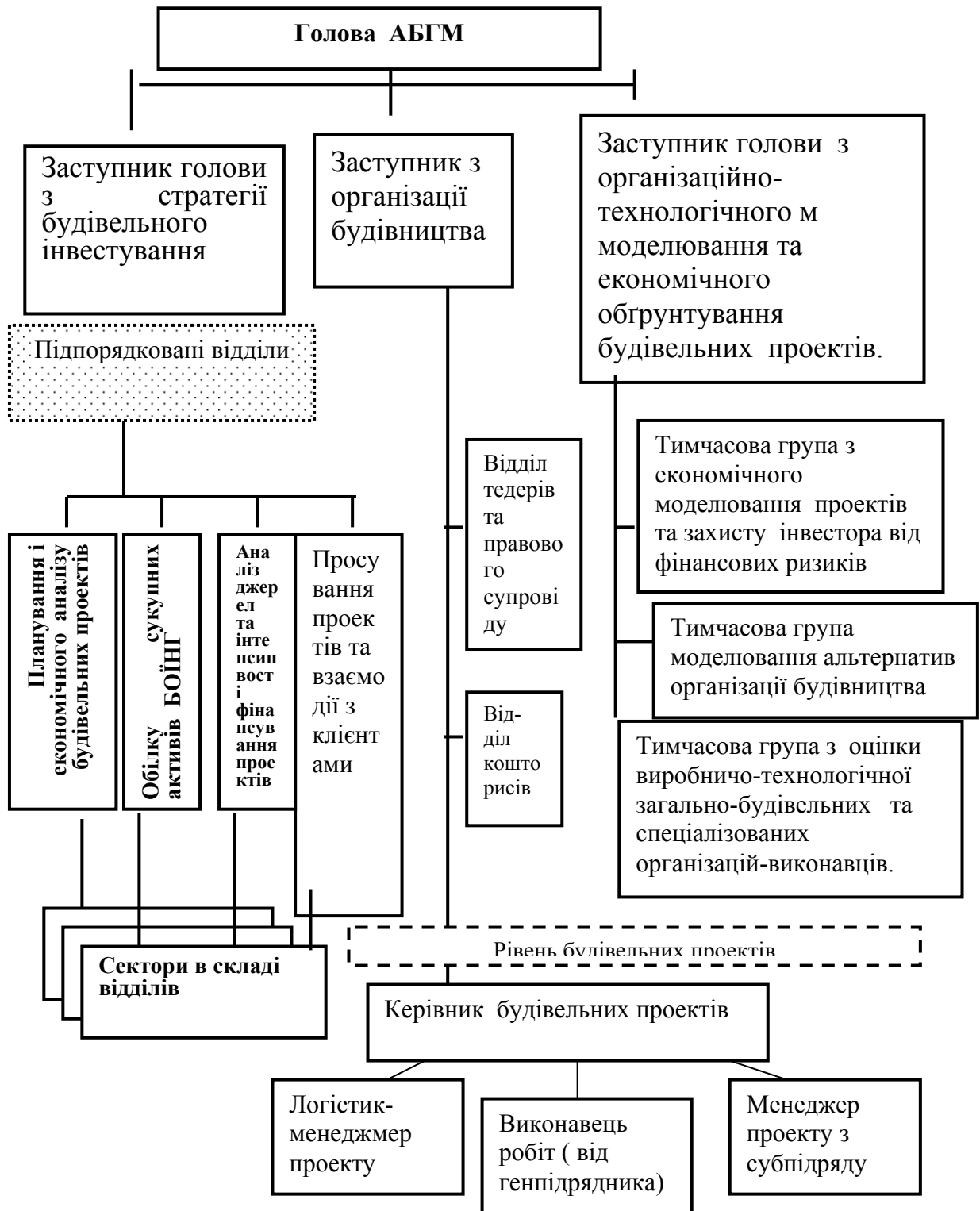
Рис.5. Альтернативний варіант ОСУ АБГМ лінійно-функціонального типу.