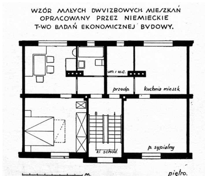
Рис.2. Схема розпланування житлової блок-секції з „малими” квартирами (Німеччина) [9]

Як перші, так і другі вважали, що важливою властивістю житлової комірки мала бути раціональність її планування, придатна для багаторазового повторення в об’ємі багатопверхового будинку, а також гнучкість і „еластичність” розпланування, що розширює поле комбінаторних можливостей в межах одного типу квартири. В цілому ж категорію „тип” архітектори-модерністи застосовували в двох її значеннях: ідеї-принципу та повторюваної моделі [11, с. 118]. Пошуки універсальної форми на основі типу, віднайдення повторюваних рис та укладання відповідної класифікації, давали можливість формулювати правила і закономірності. Останні ставали базисом творчого процесу, який мав багато спільного з науковим дослідженням. Звідси, як зазначає польський архітектурознавець, Я.Рогуська, захоплення модерністів