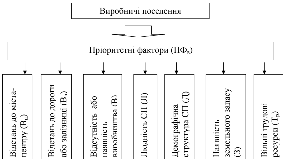
Рис. 2. Схема пріоритетних факторів для виробничих поселень