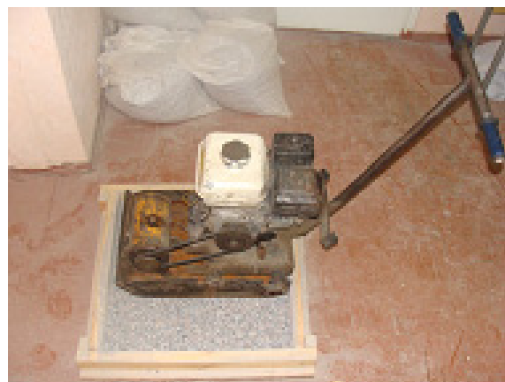
Рис. 2. Пошарове ущільнення матеріалу віброплітою

По результатам зондування визначається часова затримка сигналу при проходженні шару моделі відомої товщини (40 см).