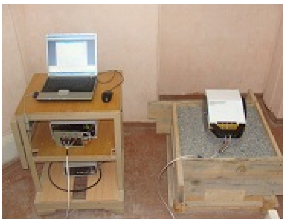
Рис. 1. Вимірювання георадаром зразка товщиною 40 см.

де M_{уц.} - маса щебеню в ущільненому стані, M_n - маса щебеню при насипній щільності.