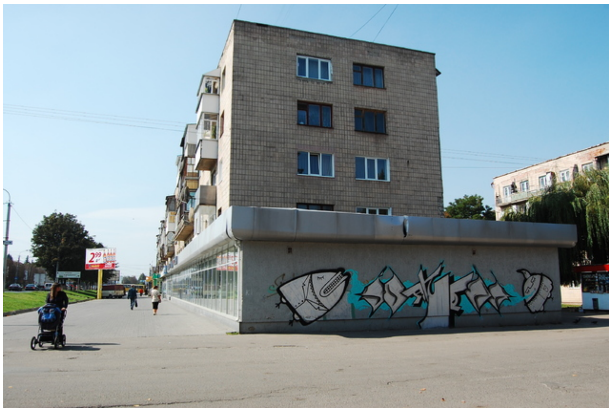
Мал. 2. Творчість Луцьких райтерів

Виклад основного матеріалу. У наше місто графіті прийшло відносно недавно, років 10 назад. Та за цей час Луцькі райтери (мал. 2) стали відомими на теренах України та за її межами. Більшість з них працюють у сфері графічного дизайну у різних фірмах, та втілюють свої ідеї в рекламі.