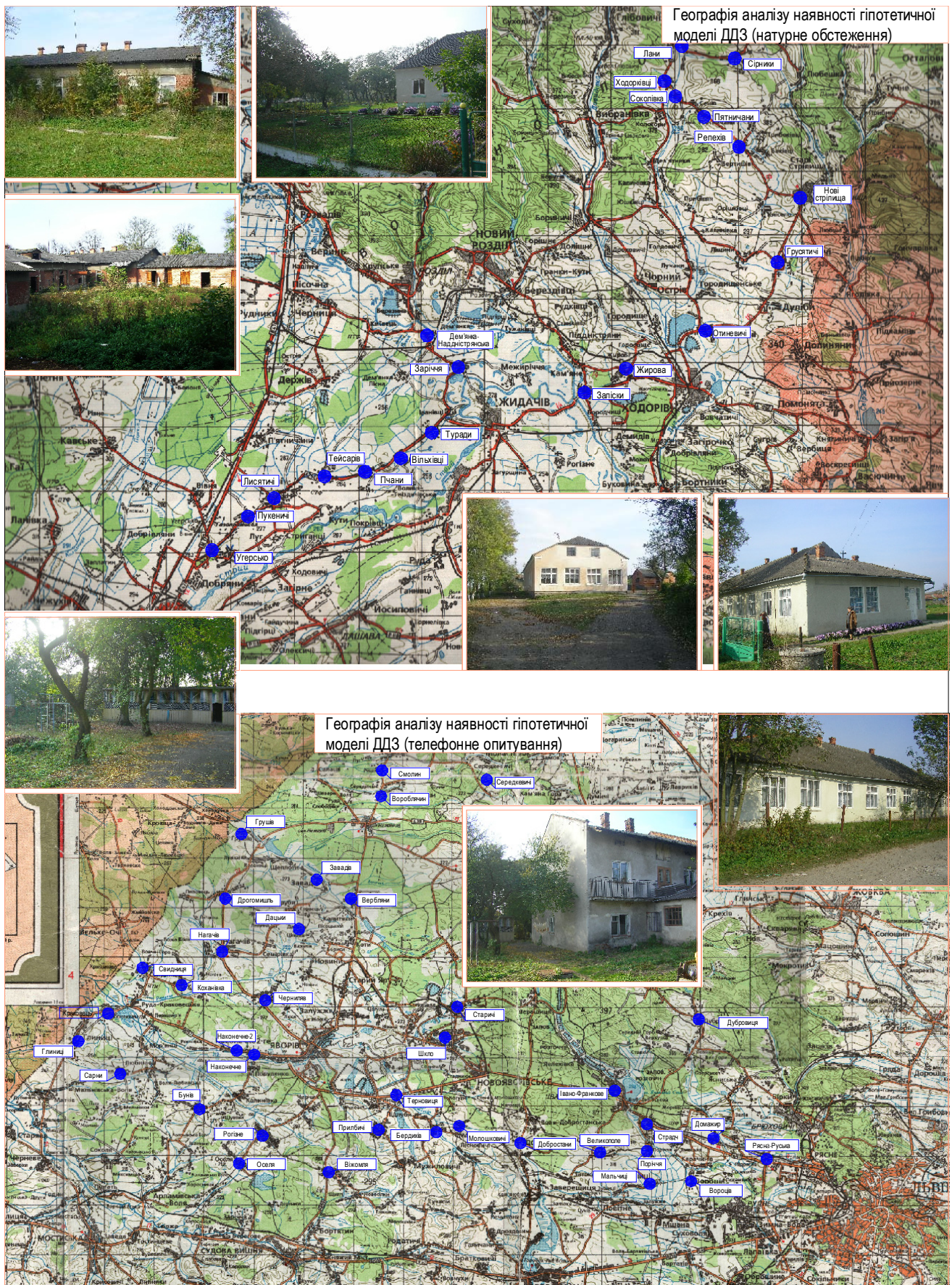
Мал. 1 Об'єкт детального аналізу