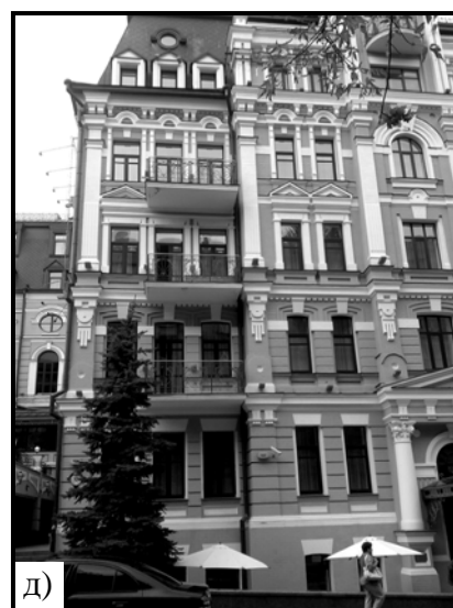
Рис. 1. Принципи використання арки в прибуткових будинках Києва кін. XIX – поч. XX ст.: а) форми арок; б) прийоми композиційного розташування арок на фасаді будинку, вул. О. Гончара; в)–д) приклади фасадів будинків з арками в), г) вул. Гончара, д) вул. Б. Хмельницького.