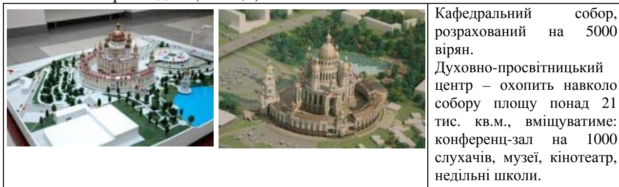
Рис.1. Проект Кафедрального собору на честь Воскресіння Христового та Духовно-просвітницького центру за адресою: м. Київ, Залізничне шосе, 3 [4]

Аналізуючи досвід проектування та будівництва духовно-культурних центрів в Україні та за кордоном, виявлено, що основними функціями є: дозвіллево-масова, соціально-педагогічна, релігієзнавча, тощо. Ці об'єкти сприяють художньо-естетичному вихованню, проведенню туристично-краєзнавчої роботи, тощо. Незважаючи на таку багатофункціональність домінуюча функція незмінно залишається за культовою будівлею, що можна побачити на прикладах. (Рис.1,2).