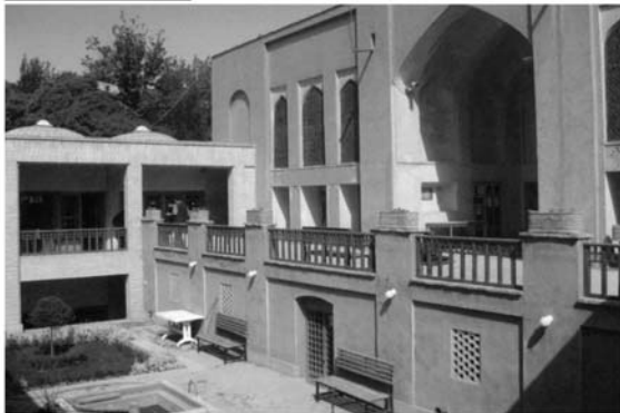
Вид на центральный двор