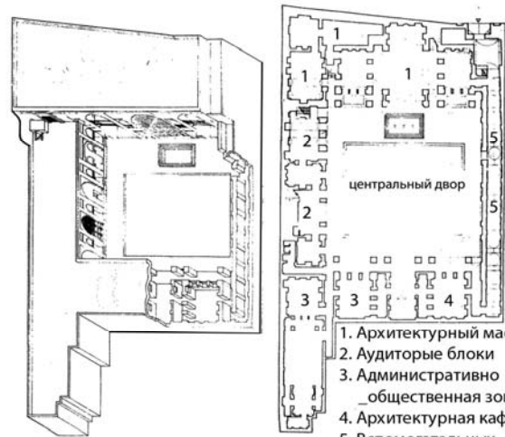
План и аксонометрия