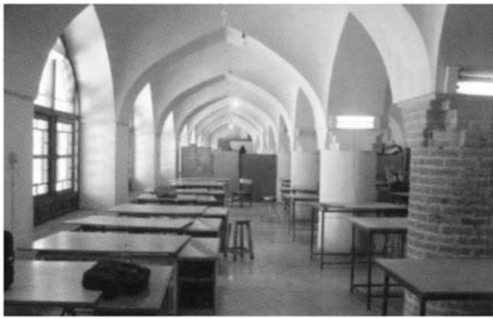
Интерьер архитектурный мастерские