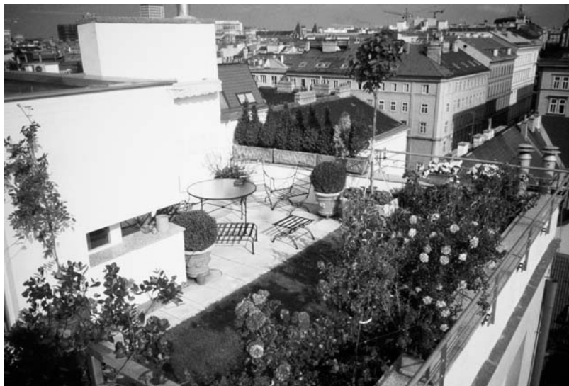
Рис. 1. Приклад озеленення дахів в Швейцарії

Сучасні сади на дахах. Архітектори всіх часів і народів мають тягу до прекрасного, але першість в створенні спеціалізованих будівельних технологій, конструкцій і покрівельних матеріалів, які застосовуються в будівництві садів на дахах спеціалісти віддають Німеччині. Німці приділяють величезне значення енергозберігаючим технологіям та екологічному проектуванню. З цією метою в країні, при будівництві нової будівлі, вимагають розробку проекту озеленення даху, а за відсутність газону чи саду на даху німецькі домовласники обкладаються додатковим податком. Подібні норми прийняли і японці, в яких при будівництві будівлі з дахом площею більшою за 100 м 2 , власники зобов'язані створювати зелені оазиси на даху. В Швейцарії ¼ всіх плоских дахів будівель складають зелені газони, а справжні сади мають більшість ресторанів та деякі компанії (рис. 1).