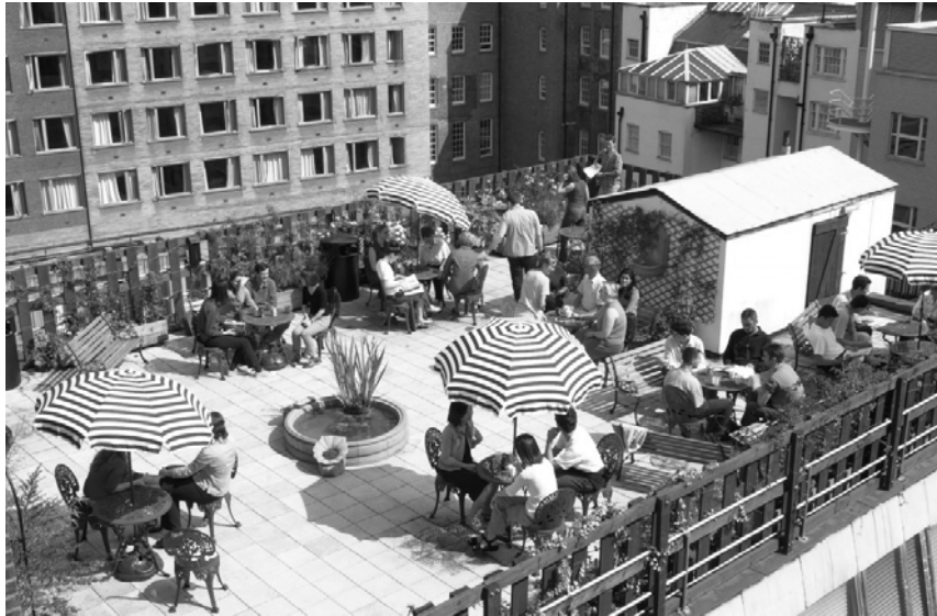
Рис. 2. Сад на даху в м. Чикаго

Ідеєю зелених дахів захопилась багато архітекторів XIX – XX ст. Американський архітектор Ф.Л. Райт в 1914 р. розробив проект за яким був побудований на півночі США в Чикаго ресторан з відкритими дахами, які забезпечували широку панораму і представляли собою справжній сад на даху. Сьогодні в Чикаго існує чимало садів на дахах звичайних житлових будівель, магазинів, кафе, розважальних центрів і навіть помітна висока конкуренція відкриття компаній, які займаються створенням і дизайном садів на дахах (рис. 2).