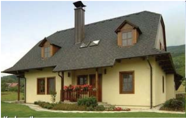
Рис. 2. Саманний будинок

Саманні будинки не тільки можуть відповідати всім сучасним вимогам до рівня комфорту, вони - основа для будівництва, так званих, будинків нульового енергоспоживання. Саман - це суміш води, глини і соломи.