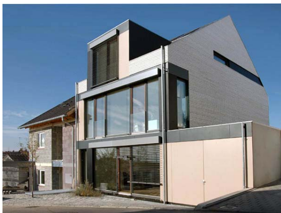
Рис. 3. Пасивний будинок

Пасивний будинок поєднує у собі високий рівень комфорту з дуже низьким споживанням енергії. Пасивні компоненти, такі як енергетично-ефективні вікна, високий рівень ізоляції та рекуперації тепла є ключовими елементами.