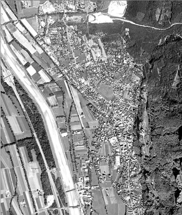
Рис. 4. Карта м. Вадуц в долині ріки. Супутникова фотозйомка