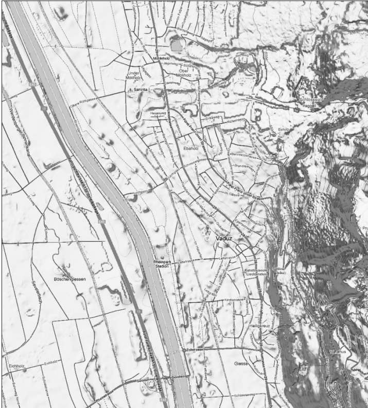
Рис. 5. Карта м. Вадуц в долині ріки з ландшафтом.