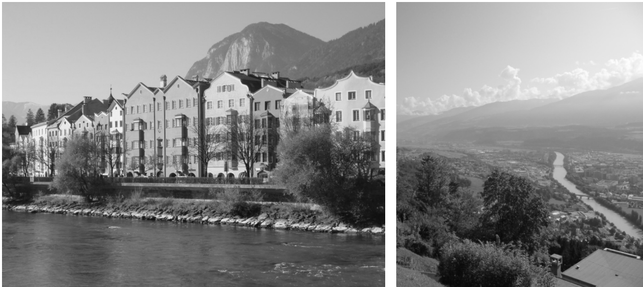
Рис. 3. Вигляд на набережну і на м. Інсбрук.

нерозривно зв'язана з ним і протікає повз центр та історичну частину міста. Здебільшого забудова розташована близько до берегів, в основному за схемою: ріка – дамба з алеєю – дорога – тротуар – споруда. Часто вздовж пішохідних алей на дамбах насажені дерева.