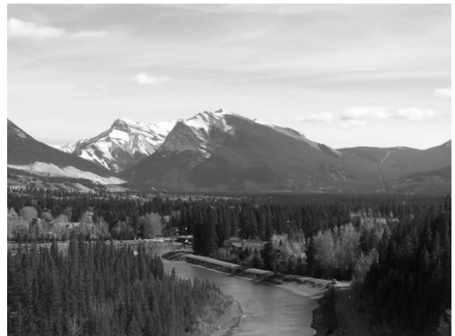
Рис. 8. Вигляд прирічкової території в м. Канмор