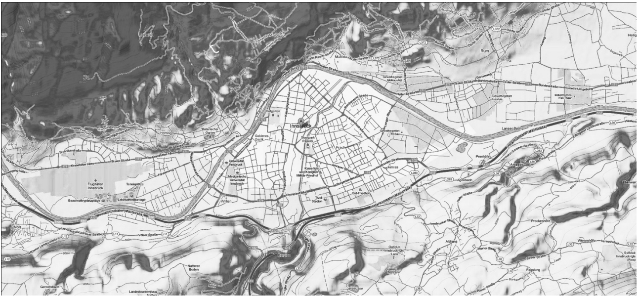
Рис. 2. Карта м. Інсбрук в долині річки з ландшафтом.