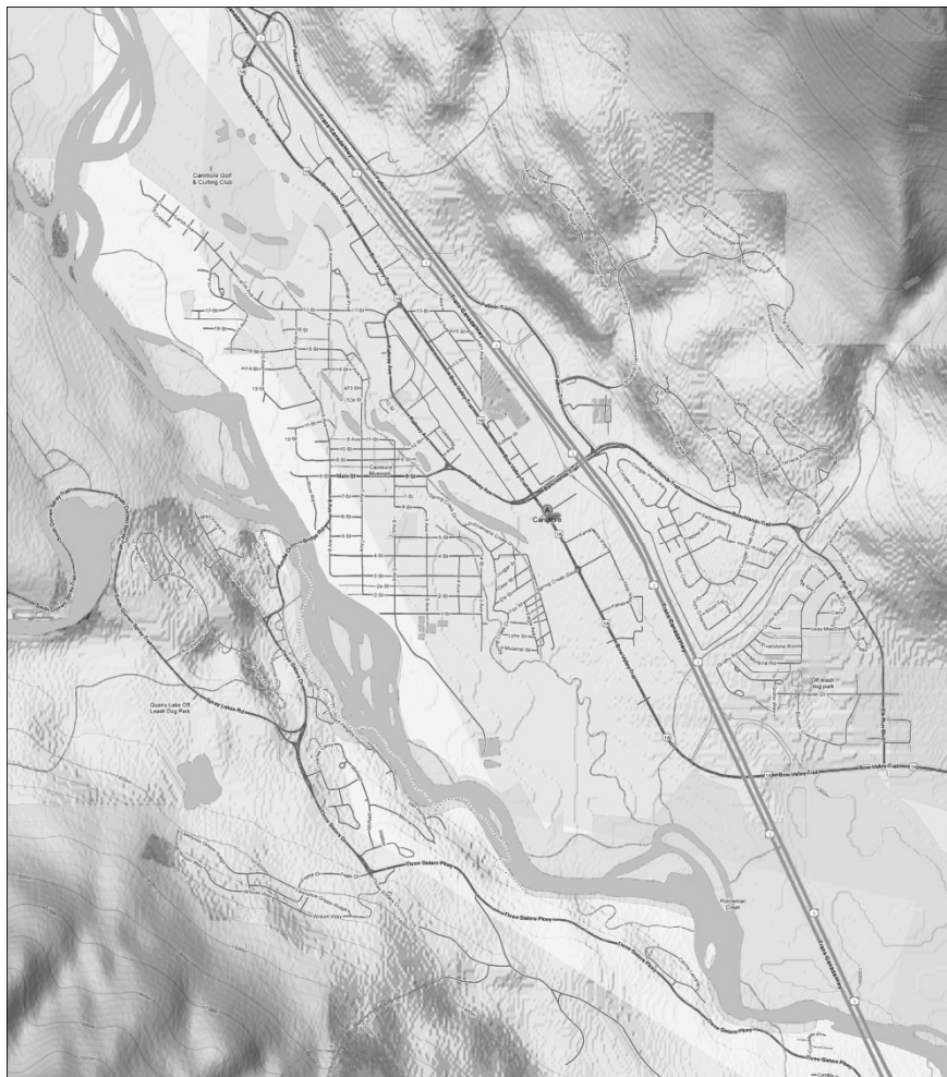
Рис. 9. Карта м. Канмор в долині ріки з ландшафтом.

річкою і магістраллю, а деякі житлові масиви виходять за ці границі. Крім перетину річки магістраллю є всього один автомобільний міст та один пішохідний, які зв'язують правий берег з лівим. Каркас вулиць і доріг здебільшого правильної форми, напрямок якій задається відносно сторін світу та основної автомагістралі.