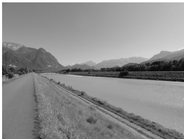
Рис. 6. Вигляд набережної в м. Вадуц.

Ландшафтно-композиційні аспекти. Красивий ландшафт в долині між горами та маленькі масштаби приваблюють туристів та людей, які хочуть відпочити. Естетику міста створюють гори, які проглядаються крізь споруди малої поверховості. Невелика кількість населення міста і самого королівства та широка долина ріки є причиною масштабних зелених територій в місті та широких природних ландшафтів вздовж річки. Ці ландшафти знаходяться зразу на приміській території, створюючи рекреаційну зону між містом і рікою, дають можливість побачити красу річкового пейзажу, незабудованого і незарегульованого людиною русла.