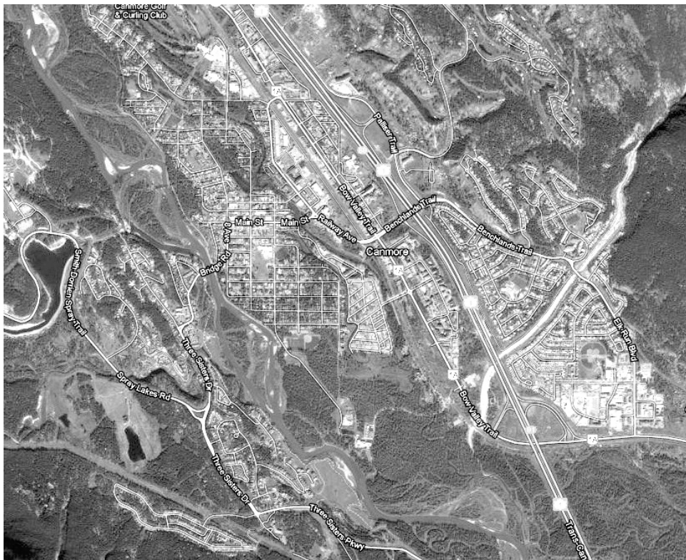
Рис. 7. Карта м. Канмор в долині ріки. Супутникова фотозйомка.

шахтарське містечко з колись невизначеним майбутнім у міжнародний туристичний центр, заробляючи репутацію передового досвіду та інновацій. [8]