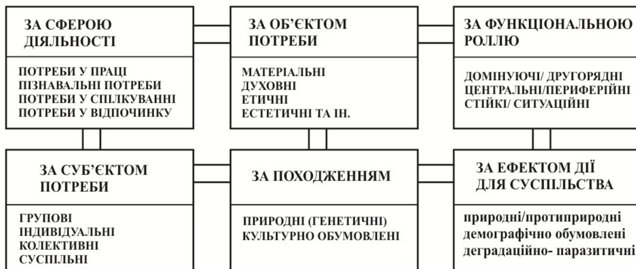
Рис. 1. Загальна класифікація потреб

функціональна роль потреби, суб'єкт потреб, походження потреб та ефект для суспільства (рис.1) .