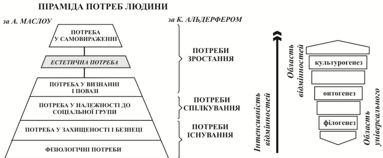
Рис. 2. Піраміда потреб людини та підстави диференціації потреб

вторинних - соціальні та духовні. Кожен тип представляє інтегрально-системну сукупність потреб , яка не зводиться до однієї потреби ні поелементно всередині групи або типу потреб, ні підсистемно. В інтегрально-системній сукупності потреб для суб'єктів кожного рівня спостерігається область універсального, загального в потребах та область відмінностей, що може виражатися в змісті окремих потреб, в різних засобах, формах та предметах їх реалізації (рис. 2).