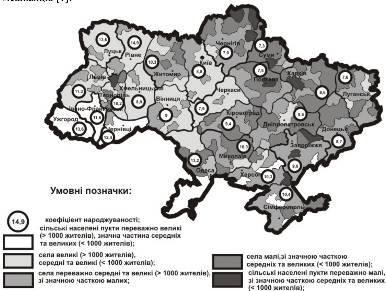
Рис.1. Особливості сільського розселення України

населених пунктах, реальним умовам проживання і потребам сільських мешканців [1].