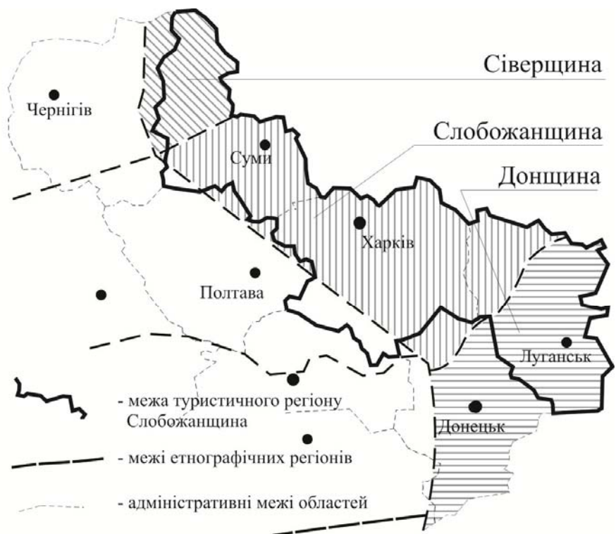
Рис.3 - Етнографічний розподіл Слобожанського туристичного регіону

Інша етнічна територія (найзначніша за територіальною ознакою) українців утворилась за рахунок їх розселення в східних і південно-східних вільних землях, також,