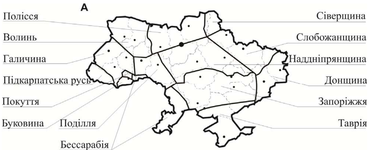
А - Історико-етнографічні регіони України (за А. Пономарьовим)