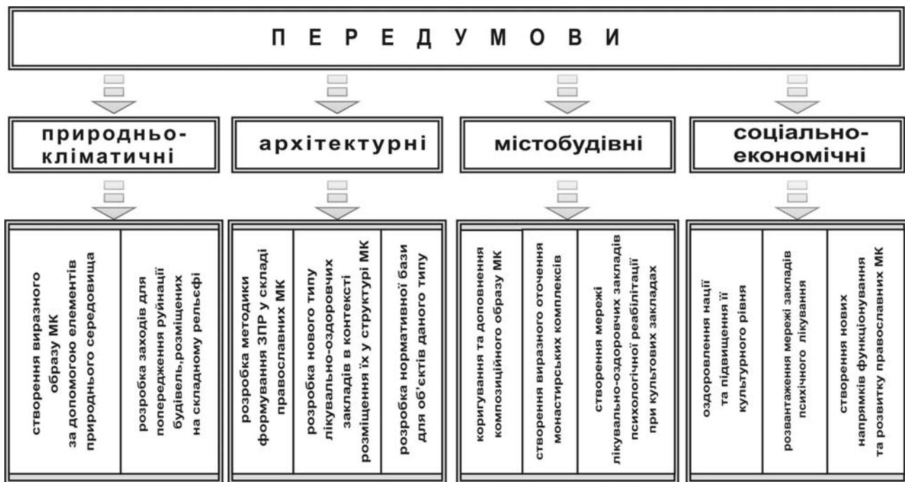
Рис.2. Передумови формування зон психологічної реабілітації населення в структурі православних монастирських комплексів.

Природньо-кліматичні передумови. Використання існуючих природних водойм та ландшафту необхідне для створення виразного образу монастирського комплексу. Питання розміщення зон та закладів на територіях зі складним рельєфом місцевості потребує ретельного вивчення та розробки заходів для попередження руйнування будівель.