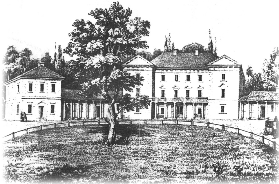
Рис. 2. П'ятничанський замок. Літографія за малюнком Н. Орди, 1870-ті роки.

мали стрічкове обрамлення (по 1 та 3 поверху). В період реконструкції розтесані по ширині та висоті (рис. 2).