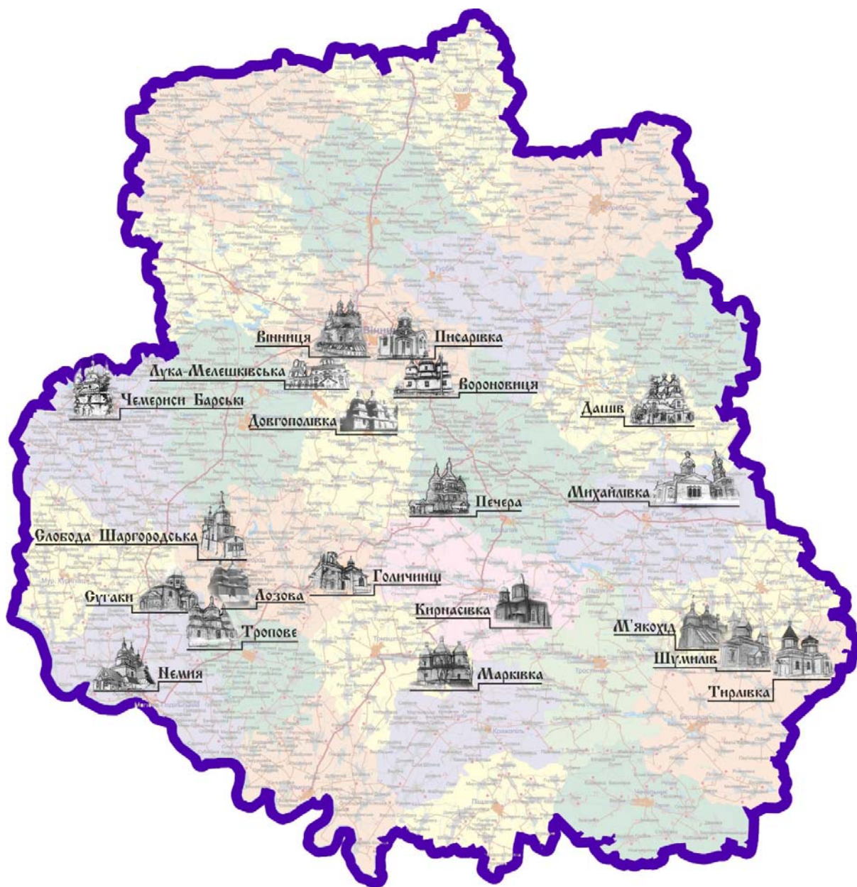
Рис. 1. Географія розташування існуючих дерев'яних храмів Східного Поділля в межах сучасної території Вінниччини

Війни та час нещадно руйнували надбання наших предків, незламною залишилась віра, уособленням якої на території Поділля став дерев'яний храм. На сьогодні кількість пам'яток сакральної дерев'яної архітектури незначна, але завдяки їм ми можемо відчутти дух живої історії (рис.1).