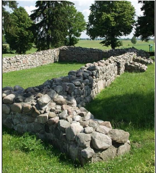
Іл. 7. Законсервовані залишки стін каплиці Пресвятої Діви Марії [7].