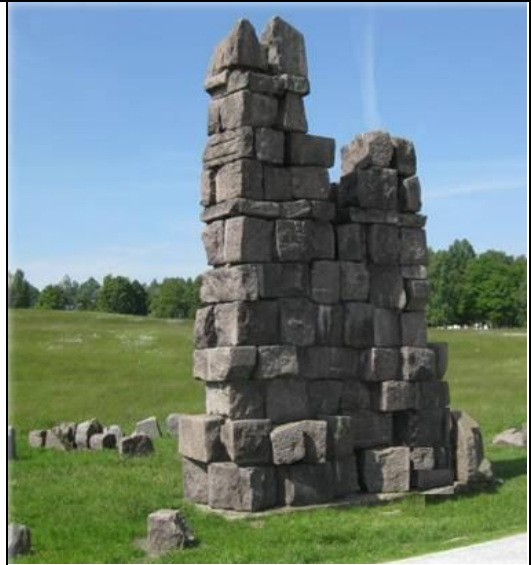
Іл. 5. “Обеліск”, складений з каменів пам'ятника 1910 р. Грюнвальдої битви, який стояв у Кракові [4].