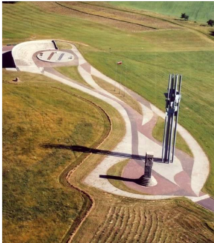
Іл. 6. Загальний вигляд меморіальної частини поля битви під Грюнвальдом з амфітеатром, макетом, щоглами-символами [7].