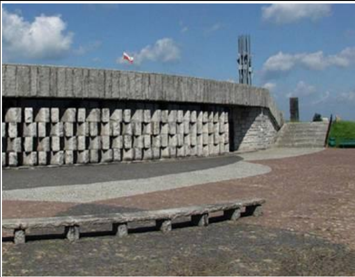
Іл. 4. Світлина фасаду музею (влаштованого під амфітеатром) на полі битви під Грюнвальдом [7].