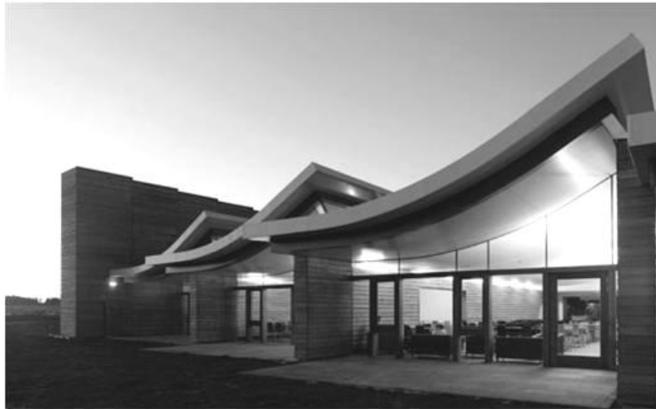
Іл. 8. Будівля нового музею і центру відвідувачів в заповіднику поля битви під Каллоден, Шотландія.