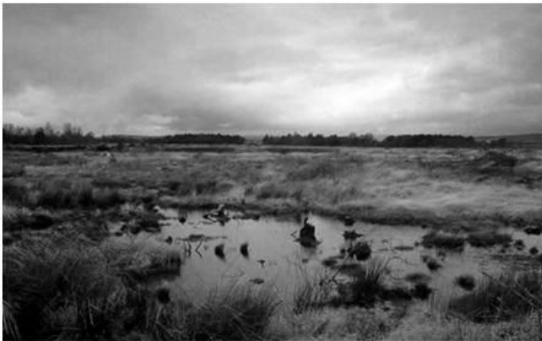
Іл. 9. Охоронюваний традиційний пейзаж та природний характер місцевості на полі битви під Каллоден.