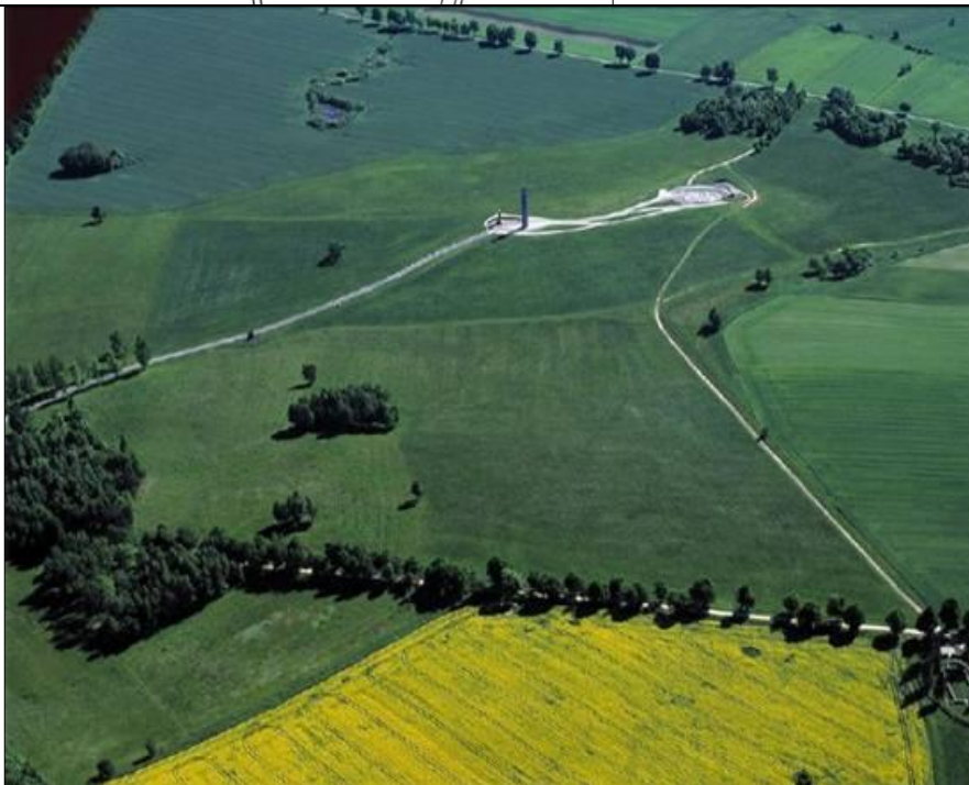
Іл. 2. Аеросвітлина заповідної частини (пам'ятки історії) - поля битви під Грюнвальдом [7].