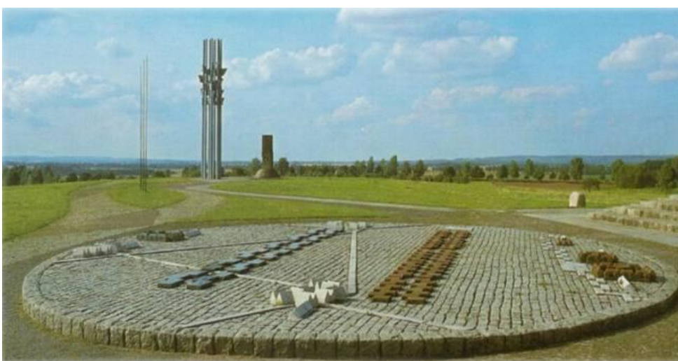
Іл. 3. Світлина кам'яної моделі з показом розташування армій на полі битви під Грюнвальдом [7].