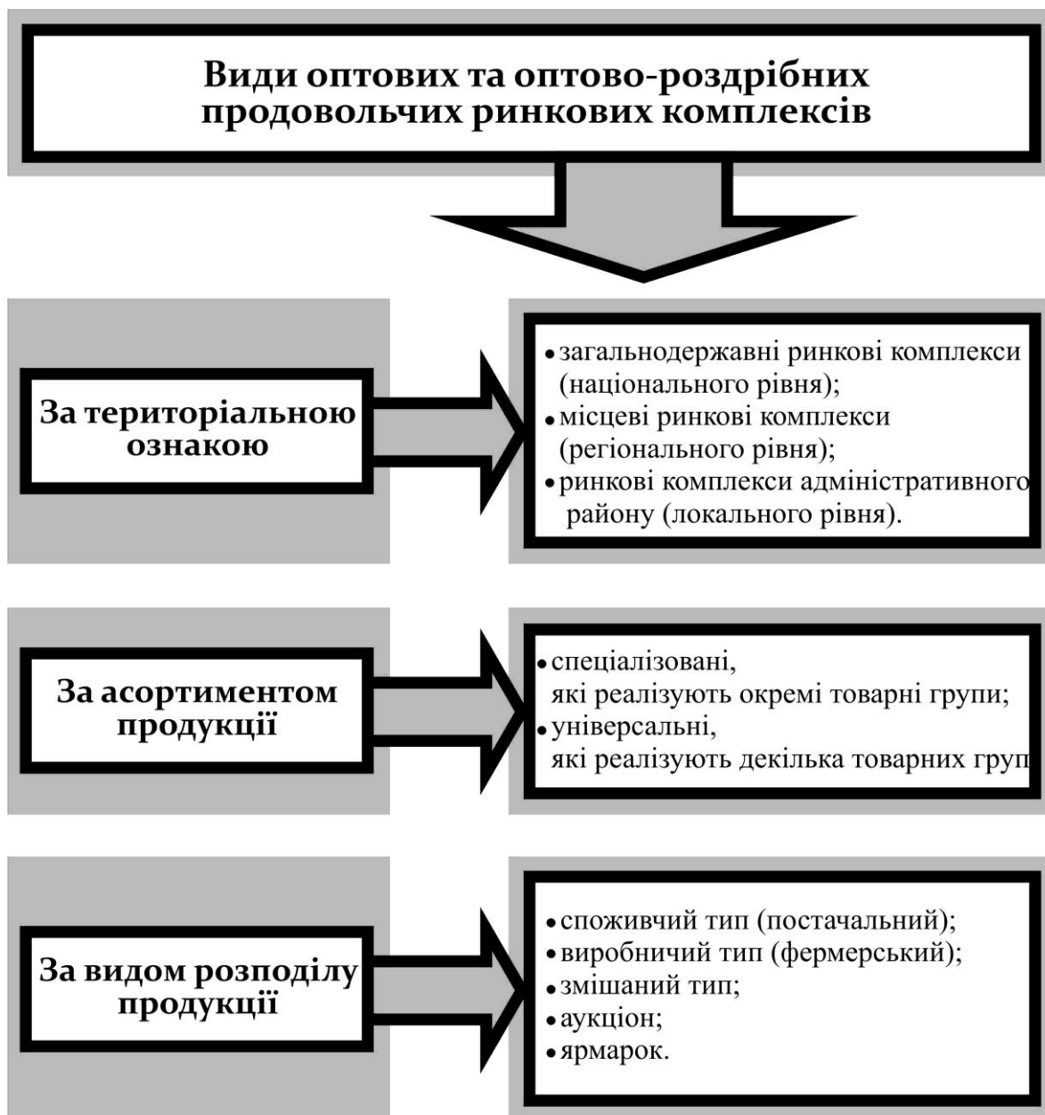
Рис.2. Класифікація видів оптових та оптово-роздрібних продовольчих ринкових комплексів.

Висновок. Отже, аналіз теоретичних концепцій показав можливість розвитку мережі оптових та оптово-роздрібних продовольчих ринкових комплексів на локальному, регіональному та загальнодержавному рівні.