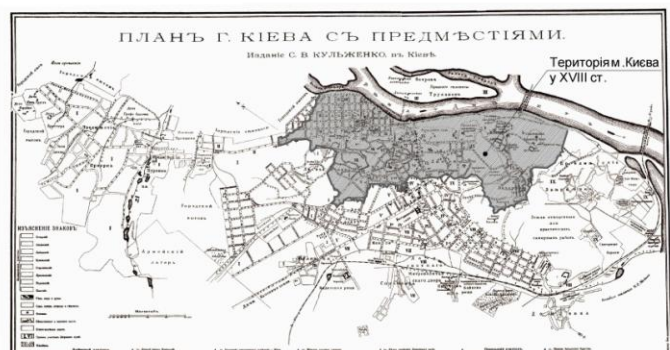
Мал.1. Територіальне розширення м. Києва у XVIII – на початку XX ст.

1) Ремісничко-цеховий та зародження мануфактур (до XVIII ст.). Цей етап характеризується територіальним суміщенням виробничої та сільбищної функції – діяльність ремісників зосереджувалась в місцях їх проживання. Лише в кінці даного етапу почалося формування відокремлених промислових підприємств, однак, зважаючи на їх невеликі розміри, вони розміщувались