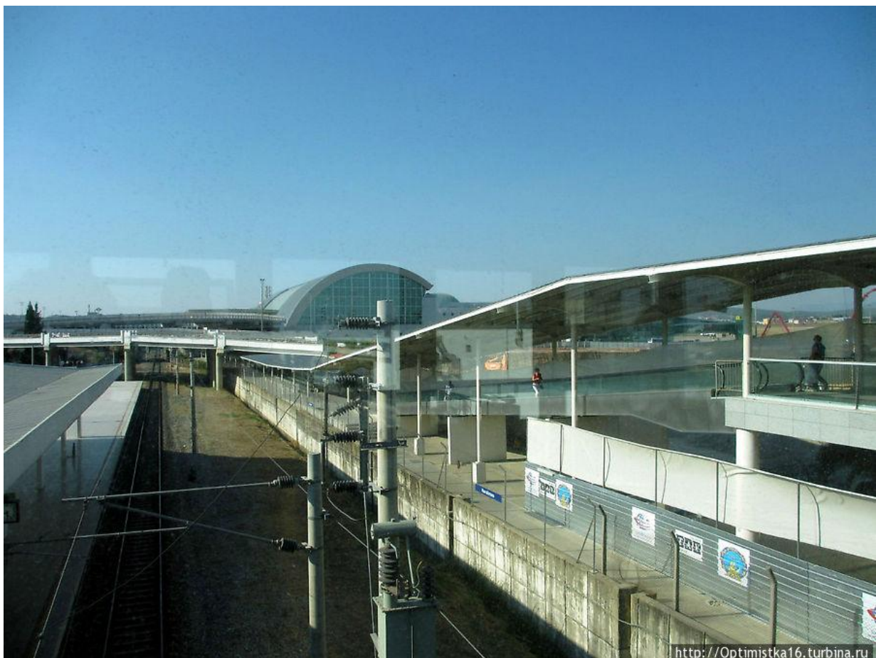
Рис.3. Під'їзний шлях до аеропорту.