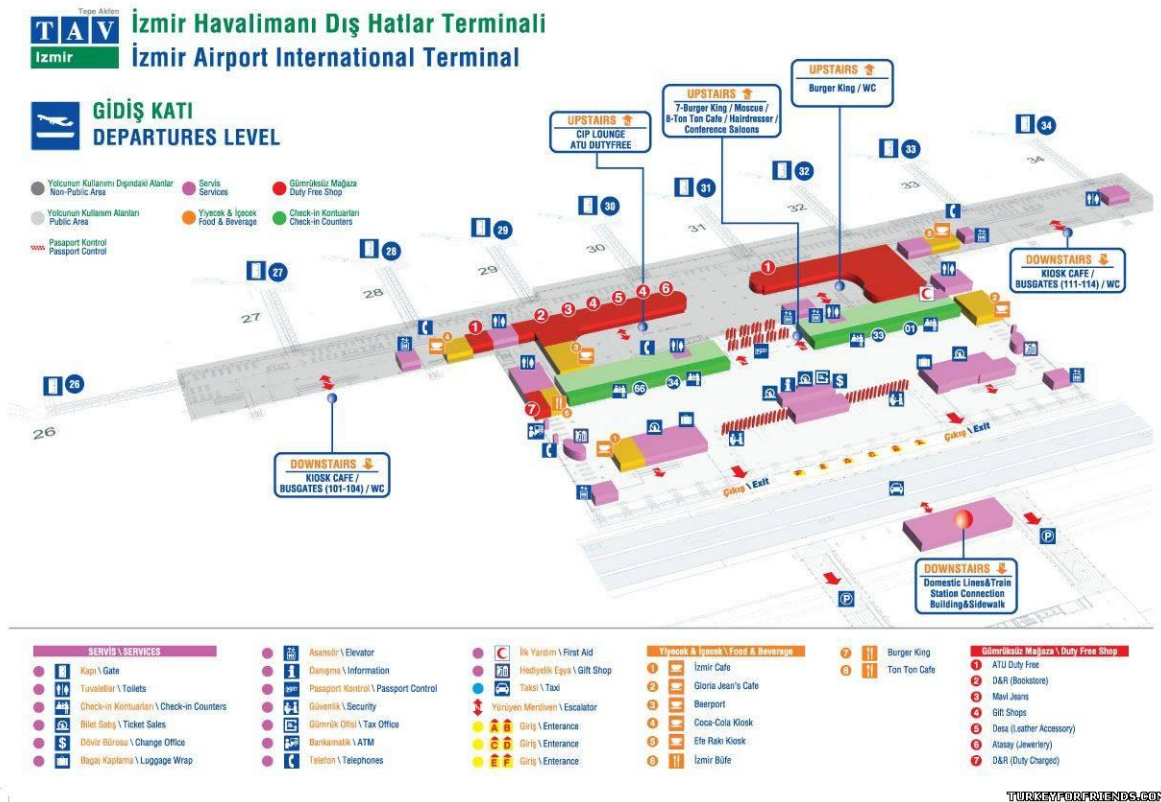
Рис.2. Схема аеропорту на виліт.