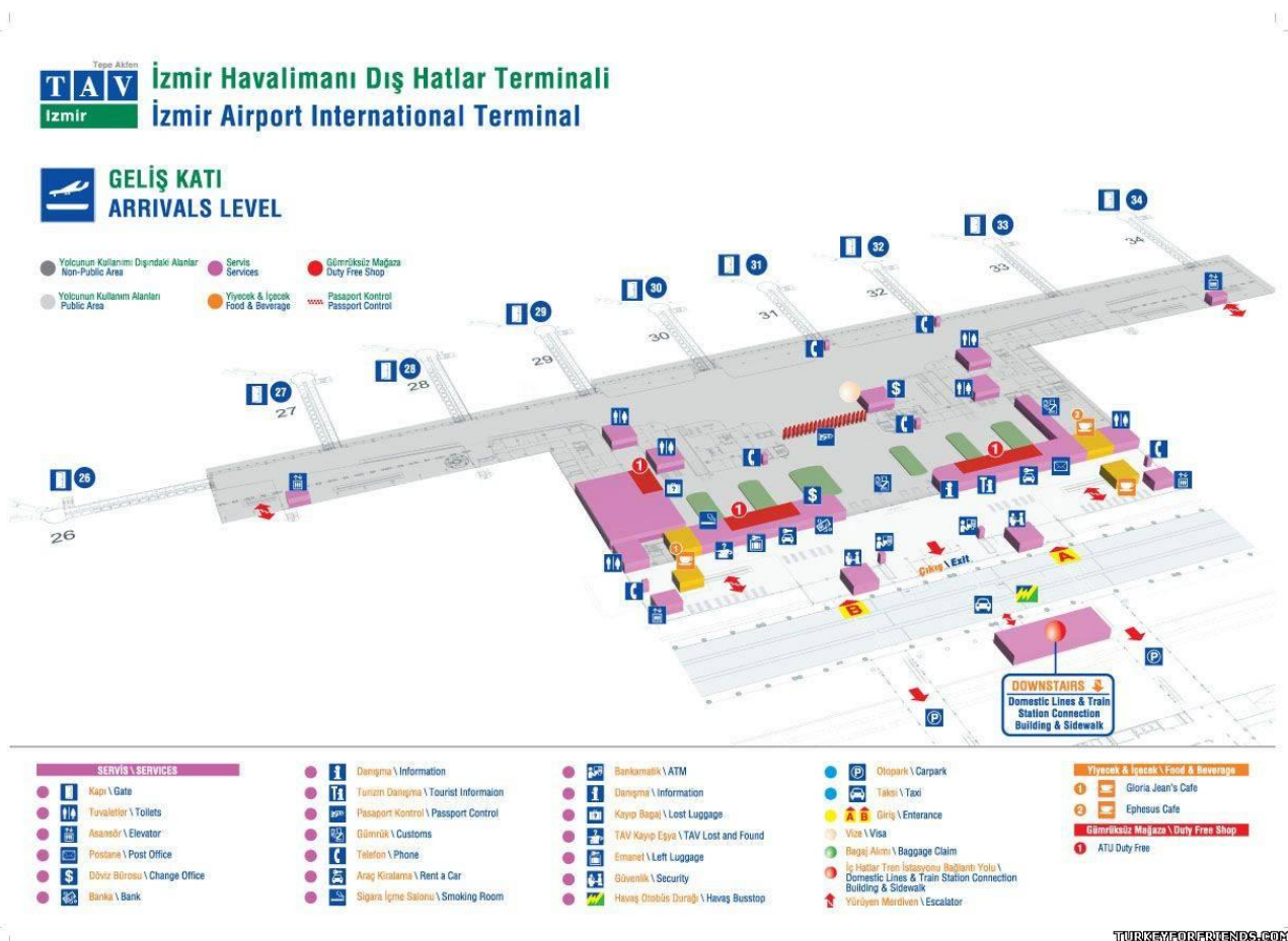
Рис.1. Схема аеропорту на приліт

Місто Ізмір та аеропорт сполучають – залізниця, метрополітен, автобуси, легкові автомобілі, таксі. Вартість проїзду по місту МПТ коштує приблизно 2-5 євро. [8]