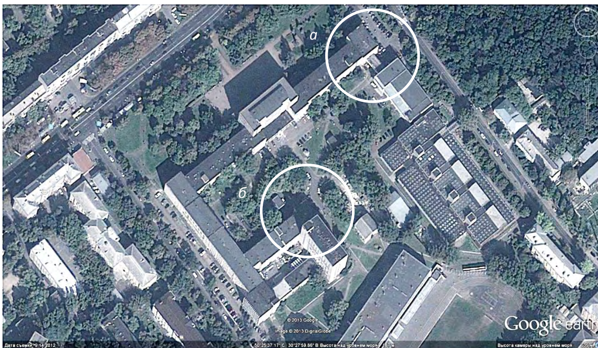
Рис. 1. Учбовий корпус КНУБА – растровий формат інформації Google

Роздивимося фрагмент з віртуального глобуса Google Планета Земля 7.0.2 – як модель кварталу розташування Київського національного університету будівництва і архітектури рис. 1 в растровому форматі.