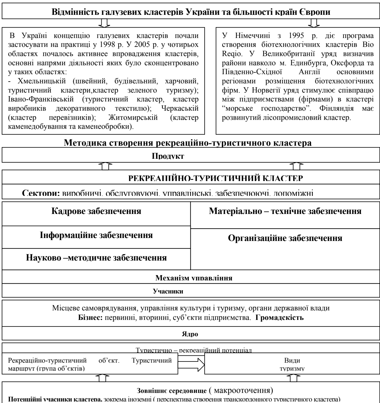
Таблиця 1. Перспективи створення рекреаційно-туристичного кластера

З вище сказаного, можна дати визначення, що рекреаційно-туристичний кластер - це об'єднання рекреаційних та туристичних ресурсів, в якому всі його учасники отримують вигоду від спільних зусиль у вигляді більш широкого кола можливостей та кінцевого загального прибутку. В рекреаційно-туристичному кластері його учасники можуть злагоджено взаємодіяти між собою та владою, а також з партнерами в Україні та за кордоном, створюються більш вигідні умови для виробництва нових рекреаційно-туристичних продуктів та послуг, в результаті чого створюється інноваційне та ділове конкурентне середовище (таблиця 1).