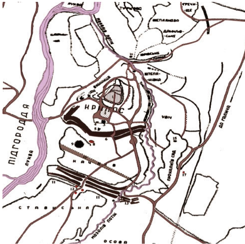
Рис. 1. План-схема укріплень стародавнього (за Л. Чачковським, Я. Хмілевським) [3]

проводилися в 1934-1941 рр., 1951-1952 рр. і 1955 р, встановлено, що на Крилоській горі місто існувало вже в X ст. При розкопках виявлено розташований дитинець і ремісничо-торговельний посад, укріплені ровами та валами. Під горою було неукріплене поселення – «підгороддя», заселене ремісниками і торговцями [2] (рис. 1).