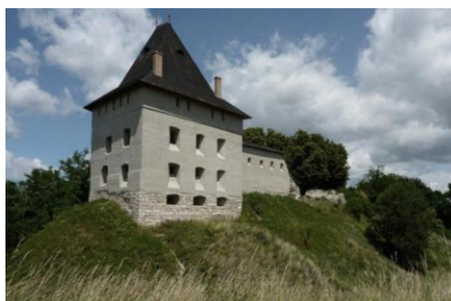
Рис. 4. Відновлена частина Галицького замку