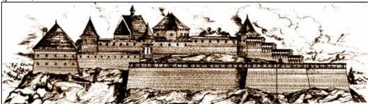
Рис. 3. Вигляд Галицького замку в кін. XVII ст. [7]

Отже, верхня частина фортеці захищалася за старою вежо-стіноювою системою оборони, а нижня – за новою – бастионною. Це був останній будівельний етап Галицького замку і фортеця мала добре продумані комбіновані вузли оборони, що взаємно захищали і доповнювали одне одного (рис. 3).