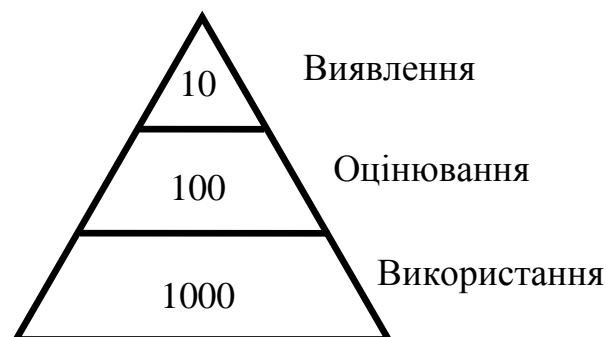
Рис. 2 Рівні деталізації метаданих

ISO 19139 [14]. Це, в свою чергу, відкриває можливість для гармонізації вимог до національних метаданих та законодавства європейських країн з територіального планування.